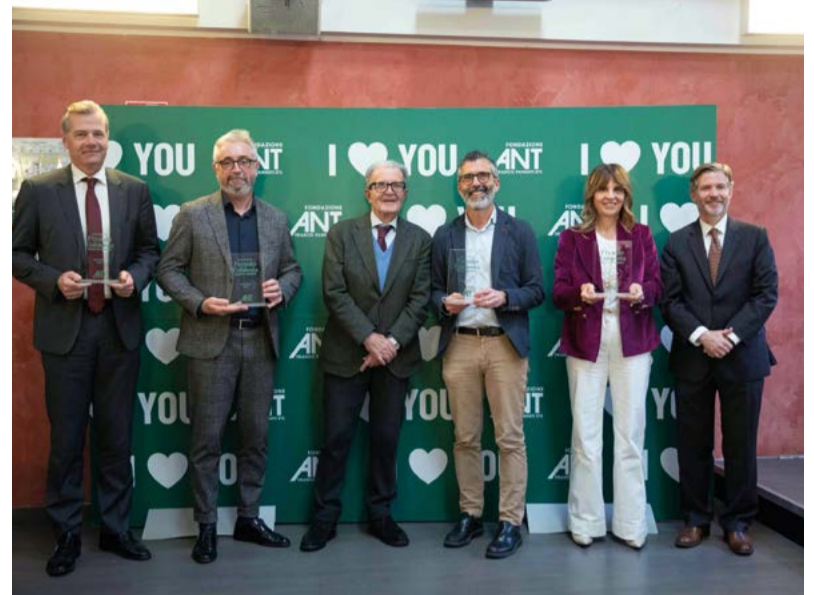
La consegna del premio Eubiosia da parte della Fondazione ANT alla BCC ravennate, forlivese e imolese

Nata a Bologna nel 1978 per iniziativa dell'oncologo Franco Pannuti, Fondazione ANT Franco Pannuti ETS fornisce assistenza medico specialistica gratuita a casa dei malati di tumore senza alcun costo per le famiglie. In base alle risorse reperite sul territorio, ANT offre inoltre progetti di prevenzione oncologica gratuiti.