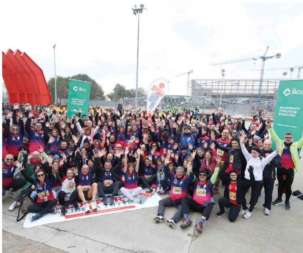
I 651 Soci, dipendenti, familiari e amici della BCC ravennate, forlivese e imolese che hanno partecipato alla 10 km ludico motoria di Ravenna