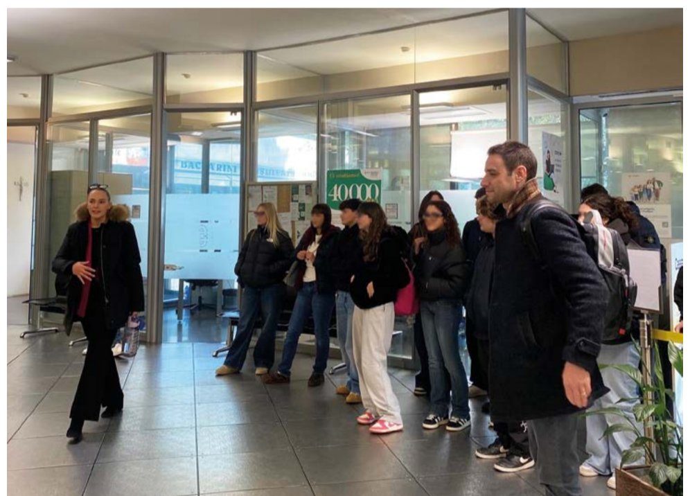
La classe 5AWeb dell'Istituto Persolino Strocchi in visita alla BCC il 19 novembre