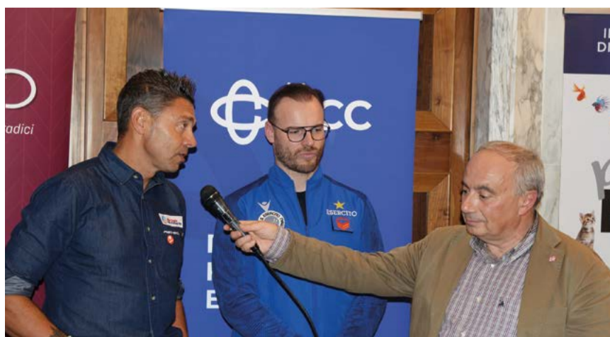
L'intervista a Giuliano Razzoli e Cristian Zorzi, i due sciatori che hanno vinto le medaglie d'oro olimpiche

Durante il fine settimana si sono alternati incontri di approfondimento in cui gli enti presenti in fiera hanno portato la loro esperienza su temi quali l'inserimento lavorativo, lo sport inclusivo, la pet therapy e l'autonomia abitativa. A completare l'offerta laboratori aperti al pubblico (argilla, pasta fresca, riciclo creativo e giochi da tavolo adattati), una dimostrazione di basket (il basket inclusivo) e momenti musicali con ospiti speciali.