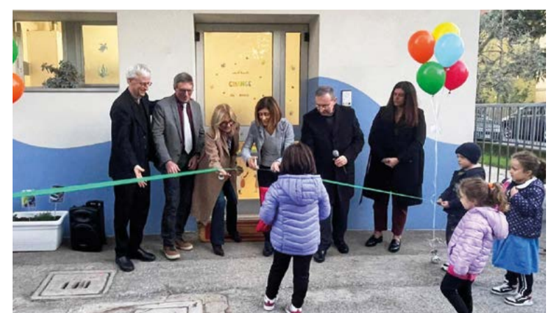
L'inaugurazione della nuova sezione scolastica nel quartiere Cava di Forlì

“Un nome simbolico per un luogo che accoglie, protegge e stimola - è stato spiegato -. Non vuole essere solo una nuova sezione scolastica, ma anche uno spazio pensato per favorire la crescita armoniosa dei bambini dai 3 ai 6 anni, dove ogni gesto educativo è guidato da cura, competenza e passione”.