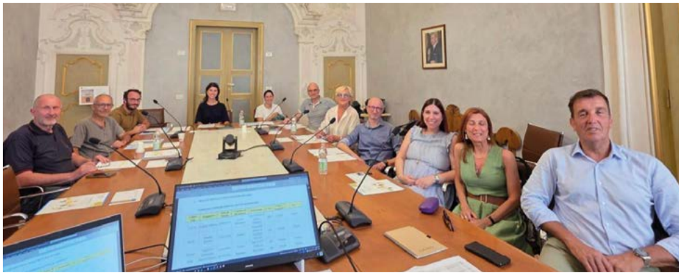
Il Comitato Locale di Faenza