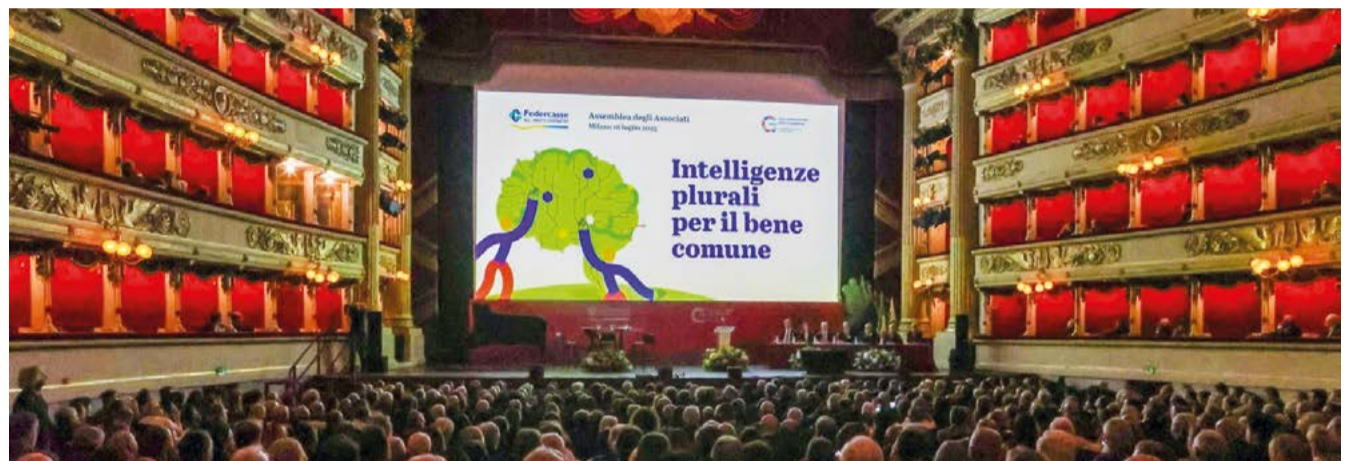
L'Assemblea di Federcasse che si è svolta il 18 luglio al Teatro alla Scala di Milano

Le BCC sono l'unica presenza bancaria in 781 Comuni (+ 5,5% su base d'anno) caratterizzati per oltre l'80% da popolazione inferiore ai 5 mila abitanti e per il 15,7% da popolazione tra i 5 mila e i 10 mila abitanti. Venti anni fa uno sportello su dieci apparteneva ad una BCC, oggi uno sportello su cinque.