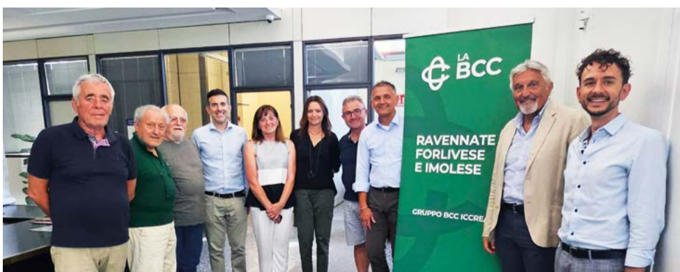
Il Comitato Locale di Romagna Centro