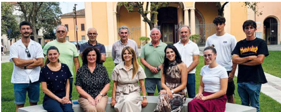
Il Comitato Locale di Lugo