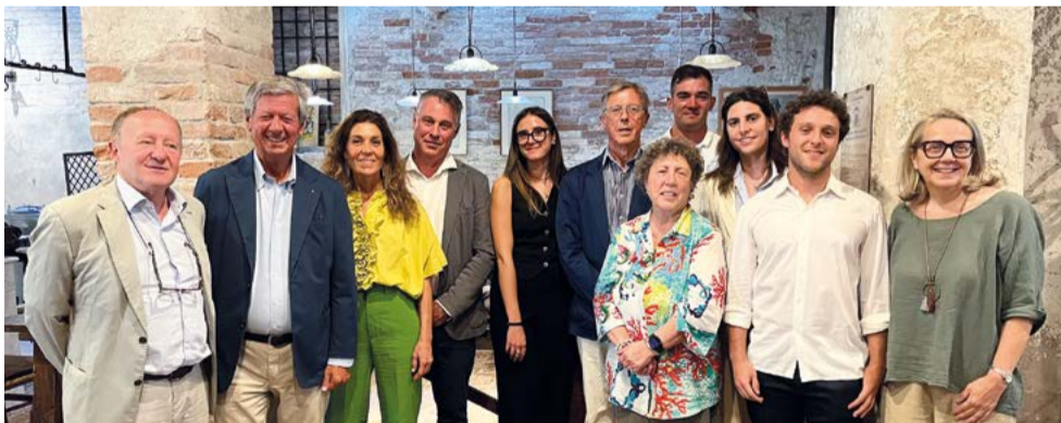
Il Comitato Locale di Ravenna