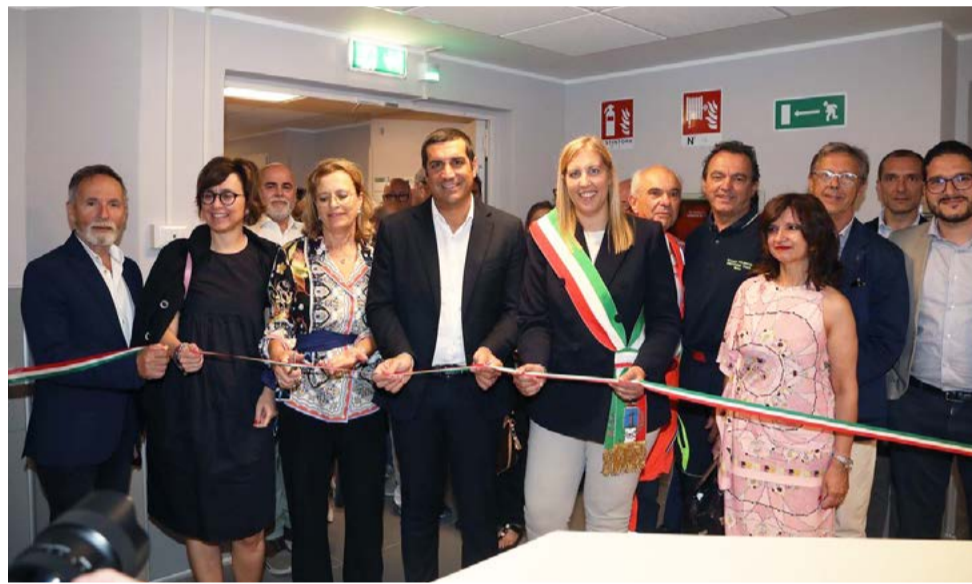
L'inaugurazione del presidio alla presenza del presidente della Regione Michele de Pascale

- accessibile anche a utenti esterni - e ambienti dedicati alla socializzazione, dotati di libreria, televisore e servizi di ristoro. Il progetto è stato reso possibile grazie ai fondi del Piano Nazionale di Ripresa e Resilienza ed ai contributi privati, che hanno dato concretezza a un'idea sostenuta dall'Amministrazione locale. La visione che ispira la realizzazione dell'Ospedale di Comunità, è quella di una sanità integrata e multidisciplinare, centrata sulla persona: per questo, negli stessi spazi troveranno posto i nuovi uffici del Servizio sociale associato e un'unità di Neuropsichiatria infantile. "Un orgoglio immenso. - ha dichiarato la Sindaca Valentina Palli nel corso dell'inaugurazione - Abbiamo dimostrato che quando si crede davvero nel valore pubblico della salute, i risultati arrivano. Questo ospedale è della comunità, e per la comunità. E oggi, possiamo dirlo con forza: ce l'abbiamo fatta".