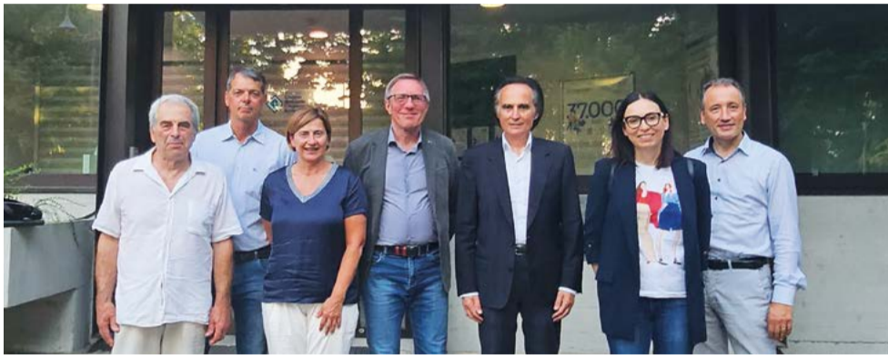
Il Comitato Locale di Forlì