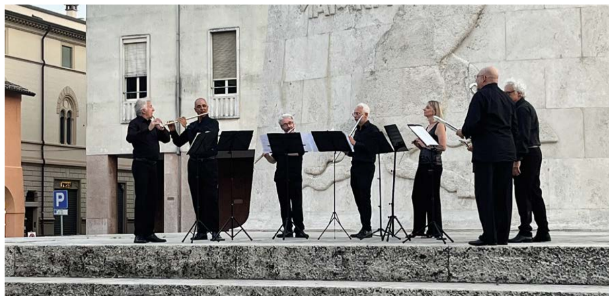
Il concerto di apertura del Lugo Flute Festival (20 luglio) ai piedi del monumento Ala di Baracca

Oltre a questo evento pubblico, il Lugo Flute Festival ha promosso lo studio e il perfezionamento del flauto da lunedì 21 a mercoledì 23 luglio, negli spazi messi a disposizione dalla scuola di Musica Malerbi, dove si sono tenute lezioni individuali a studenti provenienti da diverse regioni d'Italia.