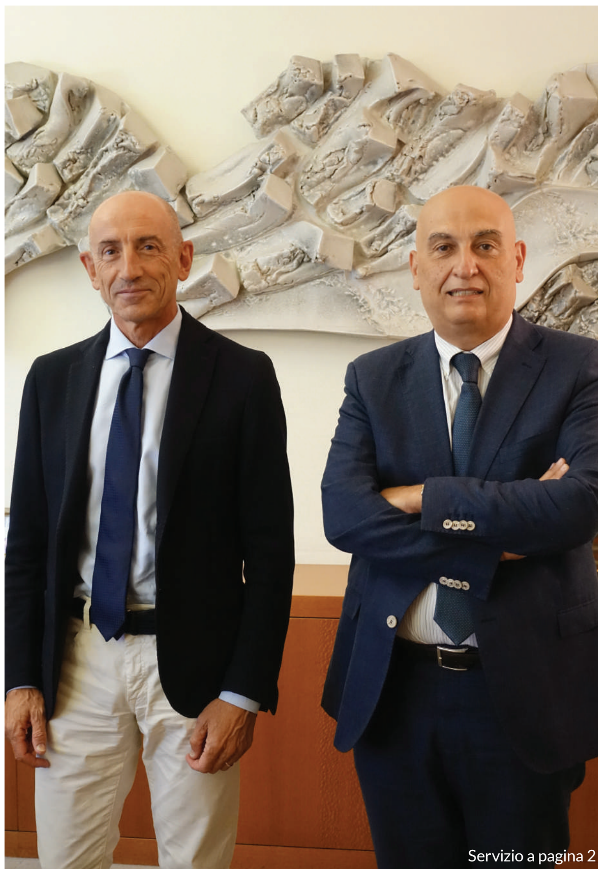
Servizio a pagina 2

Il nostro agire sul territorio si coordina a livello nazionale con l'impegno e gli altrettanto lusinghieri risultati che il Gruppo Bancario Cooperativo ICCREA ha raggiunto. Nel primo semestre dell'anno il Gruppo