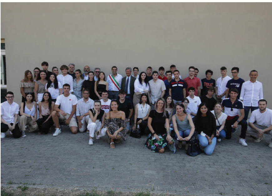
Dall'alto i ragazzi di Faenza, Lugo e Ravenna