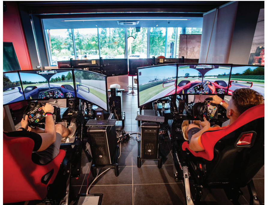
La sala simulatori SimSpeed dell'Hub Turistico Imola Faenza Tourism Company

Nel 2021, inoltre, è stata introdotta come novità dedicata agli amanti delle due e quattro ruote, la possibilità di effettuare la visita guidata dell'Autodromo di Imola a bordo della Navetta dei Motori (2 giri di pista, fermata sulla griglia di partenza, alla curva del Tamburello e visita al Memoriale Ayrton Senna, accesso agli spazi tecnici quali Race Control Room, paddock e podio) e una sessione di guida presso la sala simulatori SimSpeed Room dell'Hub Turistico di IF Imola Faenza Tourism Company (simulatore di guida GT; durata complessiva dell'evento circa un'ora e mezza). Tutte le informazioni su come i Soci possono prenotare sono disponibili sul sito www.labcc.it .