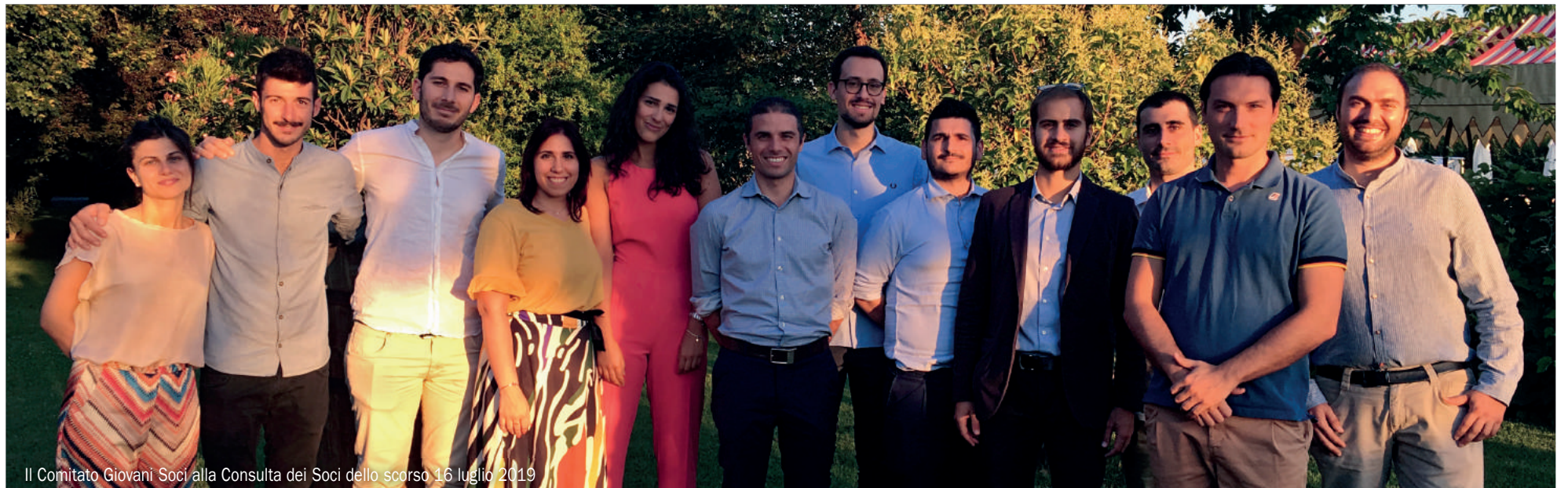
Il Comitato Giovani Soci alla Consulta dei Soci dello scorso 16 luglio 2019

tato Giovani Soci è promotore di una tavola rotonda che coinvolge giovani operatori agricoli del territorio e presenta esperienze di agricoltura innovativa. Al termine della tavola rotonda è previsto un momento conviviale riservato ai Soci BCC under 35. Segui gli aggiornamenti sul sito www.labcc.it .