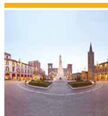
Il 7 ottobre 2017 festa a Forlì per presentare l’operatività de LA BCC