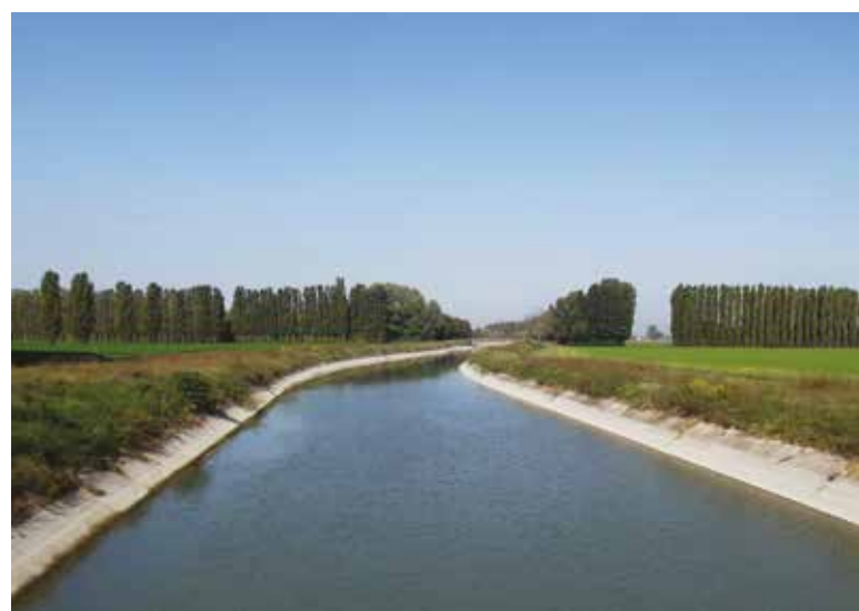
Il Canale Emiliano Romagnolo

Oltre a questa iniziativa, nel nostro territorio di competenza sono presenti vari consorzi irrigui costituiti tra imprenditori agricoli di territori limitrofi al fine di costituire o ampliare invasi per la