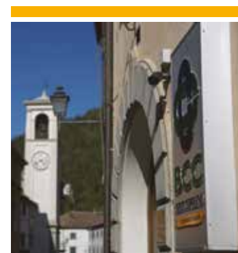
La cooperazione di credito di Trezzano compie 100 anni. Le celebrazioni il 23 settembre 2017