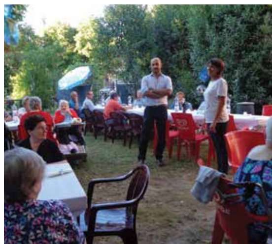
La Casa Residenza Anziani di Fusignano nel giorno della "salsicciata" che si è svolta lo scorso 24 agosto