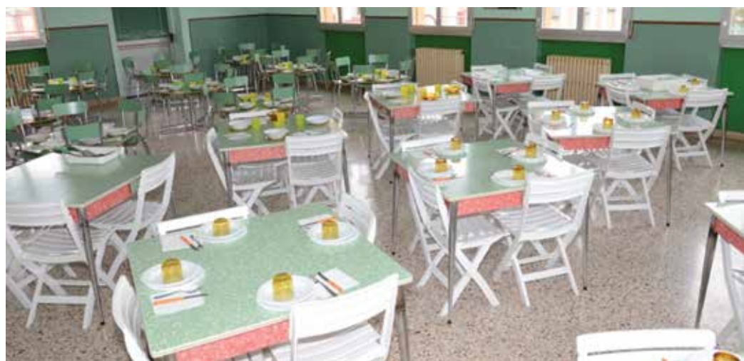
La sala mensa della scuola primaria e infanzia

Proprio in questi giorni sono in corso lavori di rinnovo locali e adeguamento strutturale della scuola alle normative legate alla sicurezza. Per la realizzazione di questi lavori, che coinvolgono aziende del territorio come Cmc Faenza, Tecno protezione, Baldetti, Adria Sistem e La Villa Bella si prevede una spesa di circa 230mila euro. Ovviamente la ristrutturazione si concluderà in tempo utile per garantire il normale avvio dell'anno scolastico 2016/2017.