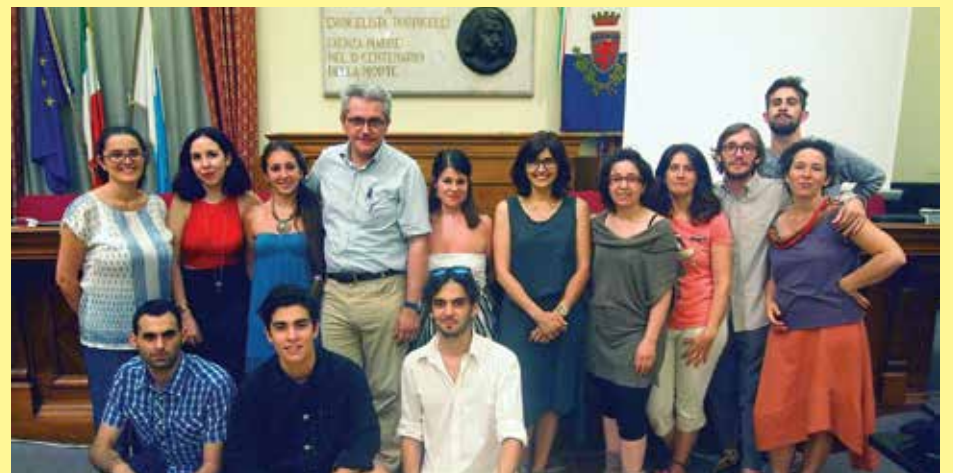
Alcuni dei partecipanti e dei promotori nel giorno dell'incontro con gli amministratori comunali

ministratori dell'Unione della Romagna faentina l'agenda da loro elaborata nel corso del progetto, contenente future proposte da attuare sul territorio: facilitare la partecipazione dei giovani che non sono già coinvolti in associazioni e realtà strutturate presenti sul territorio, creare occasioni che consentano ai giovani di sperimentarsi e di essere "scoperti" come risorse per il territorio, favorire il contatto dei giovani con le realtà esistenti, promuovere la creazione di nuove realtà associative/aggregative, consolidare la rete fra le associazioni e le realtà informali ma operative, e molto altro.