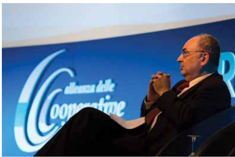
Maurizio Gardini, presidente Confcooperative

Infine l'ultimo step, che si svolgerà a novembre, dovrà definire un'ipotesi di struttura; ipotizzare modelli di pianta organica e di simulazioni di organigramma; definire un modello contributivo; programmare gli impegni nei territori per il 2017 e