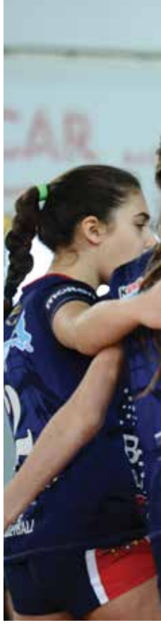
Giocatrici della Scuola