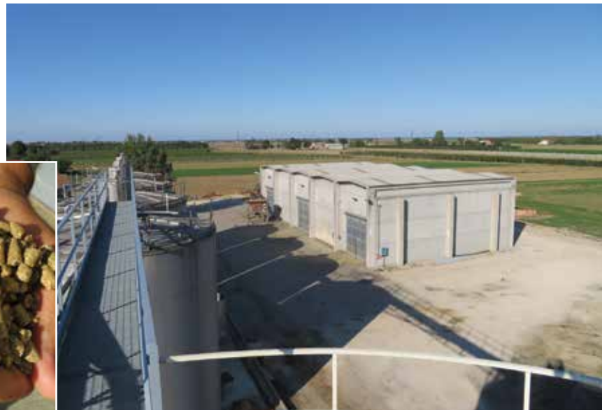
In alto a destra i magazzini dove viene stipato il pellet di erba medica. A sinistra come si presenta il pellet di paglia