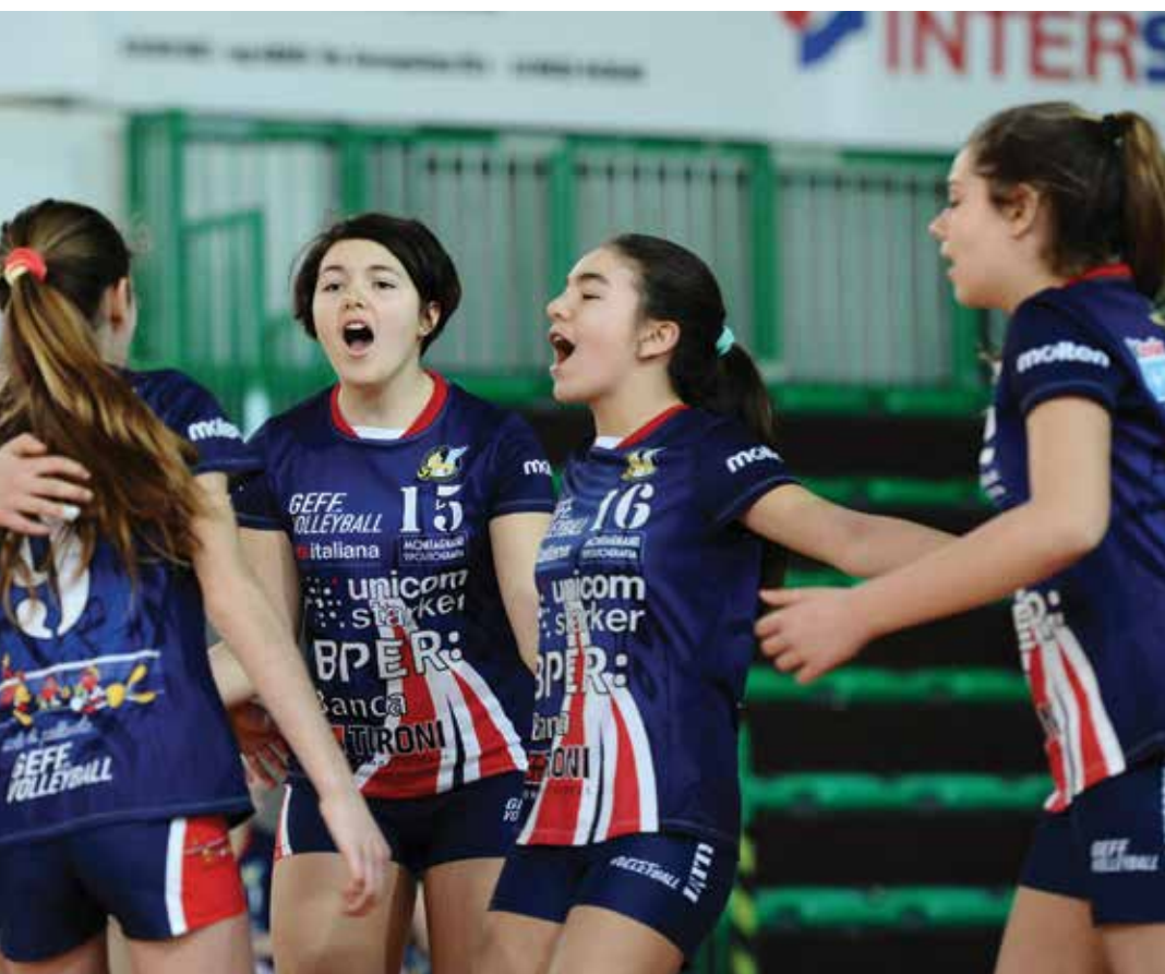
a di pallavolo Anderlini di Modena