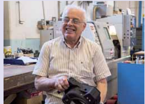
Artigiano, Socio BCC e Amministratore del Credito Cooperativo ravennate e imolese dal 1975 al 2010

Un'intervista ad un Socio che ha da sempre accompagnato la storia della nostra banca.