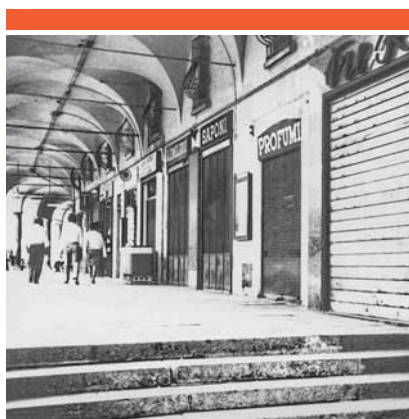
N. 717-794