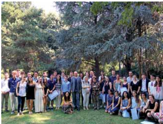
La premiazione dei supermaturi di Faenza nel giardino nei pressi della Sala Giovanni dalle Fabbriche

166 supermaturi premiati dalla nostra Banca a Lugo, Faenza e Ravenna in occasione delle cerimonie per gli studenti, che hanno conseguito la maturità con il massimo dei voti.