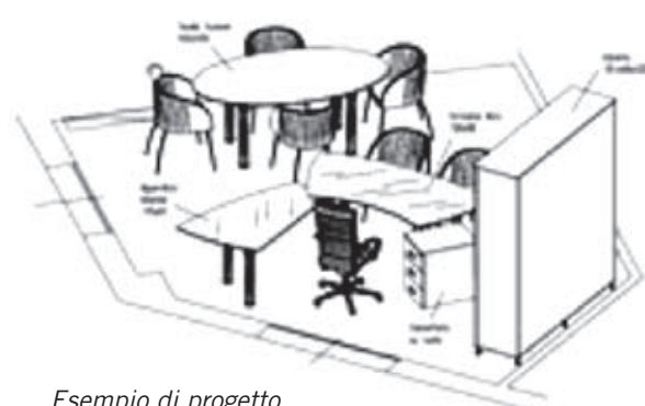
Esempio di progetto