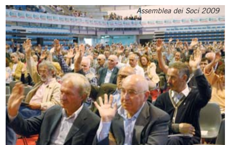
Assemblea dei Soci 2009

A fine 2008 i nostri Soci erano 14.474; di questi, ben 13.300 hanno visto aumentare la loro quota di azioni grazie all'introduzione del ristorno. 1.353 sono, invece, quelli che si sono visti attribuire, per l'esercizio 2008, una quota di ristorno significativa, pari o superiore a 150 Euro (corrispondente a circa 58 azioni). Il tetto massimo di 500 azioni (1.290 Euro) è stato, invece, attribuito a 40 Soci.