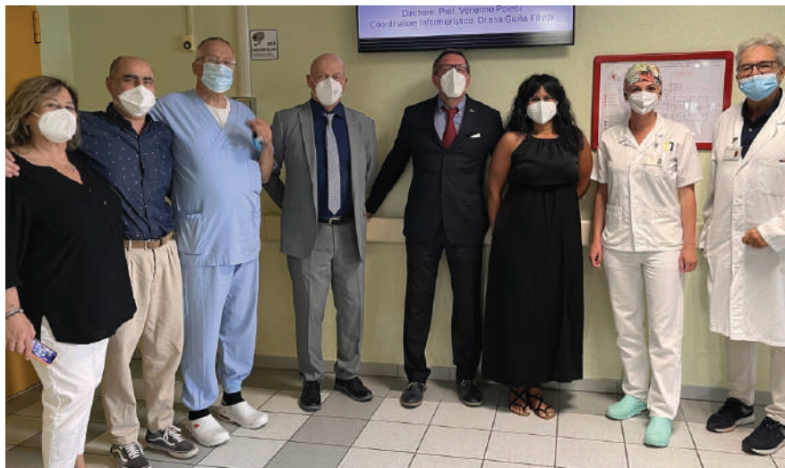
La consegna dell'impianto di filodiffusione all'Ospedale Morgagni-Pierantoni

Interventi di rinnovo di locali e strutture parrocchiali