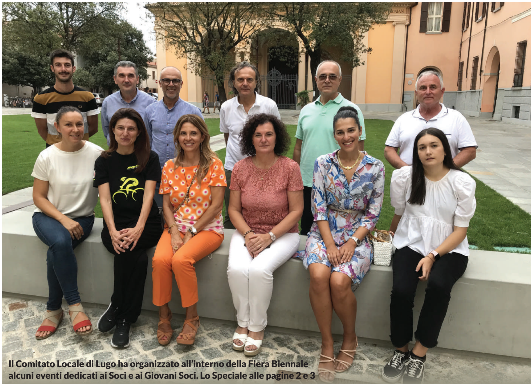
Il Comitato Locale di Lugo ha organizzato all'interno della Fiera Biennale alcuni eventi dedicati ai Soci e ai Giovani Soci. Lo Speciale alle pagine 2 e 3