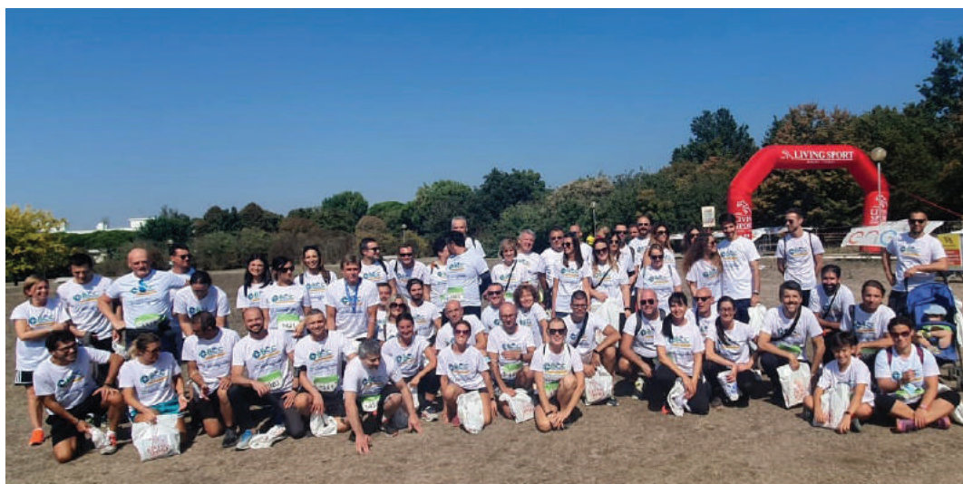
Due foto di gruppo degli “atleti” de LA BCC e del Credito Cooperativo Romagnolo

benessere e degli stili di vita sani e salutari che il CRAL dei lavoratori porta avanti in collaborazione con l’azienda. Questa iniziativa rientra nei progetti inseriti all’interno del Piano di Sostenibilità della Banca per la promozione e la diffusione del welfare. Da segnalare anche la formazione sulle tematiche del “care giving”, che prevede la possibilità per i dipendenti di seguire corsi per capire come meglio prendersi cura ed assistere i familiari che necessitano di aiuto.