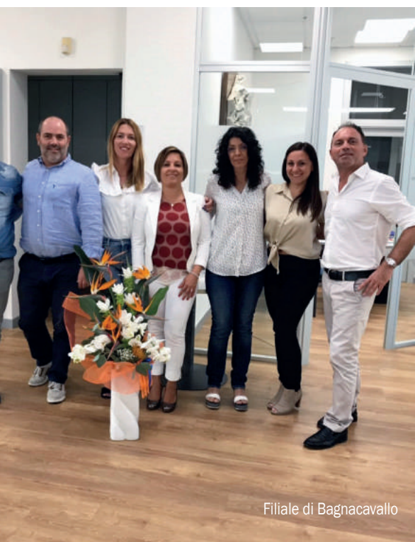
Filiale di Bagnacavallo