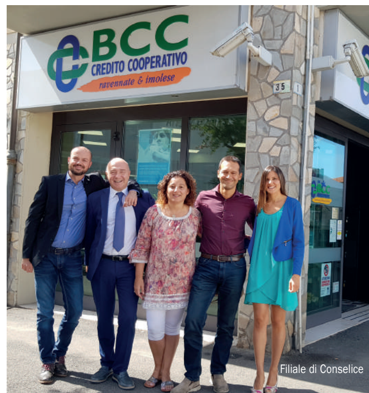
Filiale di Conselice

Cambio di look per le filiali di Bagnacavallo e Conselice. Terminati i lavori di restyling degli uffici siamo pronti per scoprire insieme a Soci e clienti i nuovi locali! Inaugura Bagnacavallo sabato 28 settembre 2019 alle ore 17.00 insieme alle autorità cittadine con un momento di incontro conviviale in filiale e poi tutti a spasso per la città in occasione della festa di San Michele! A Conselice giovedì 3 ottobre 2019 alle ore 17.30 assisteremo alla presentazione della mostra di Valeria Cerruti, pittrice imolese, che darà un tocco di colore alla filiale e l'Associazione Bianconiglio proporrà animazioni per i bambini.