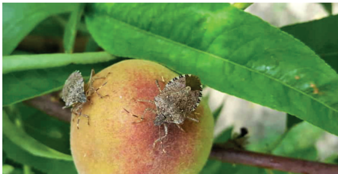
La cimice asiatica è originaria dell’Asia orientale, dove è presente in Cina, nelle due Coree, Giappone e Taiwan. E’ stata avvistata in Italia per la prima volta nel 2012, e la sua proliferazione è stata agevolata dalle alte temperature estive e dagli inverni miti. La specie, altamente invasiva, è stata introdotta accidentalmente dall’uomo con i traffici commerciali. L’insetto, che non è pericoloso per l’uomo, lo è, invece, per il mondo vegetale.

Il nostro plafond, concordato con la Coldiretti, verrà comunque aperto da LA BCC a tutte le aziende Socie e clienti del territorio. Le nostre filiali sono a disposizione per informazioni e chiarimenti.