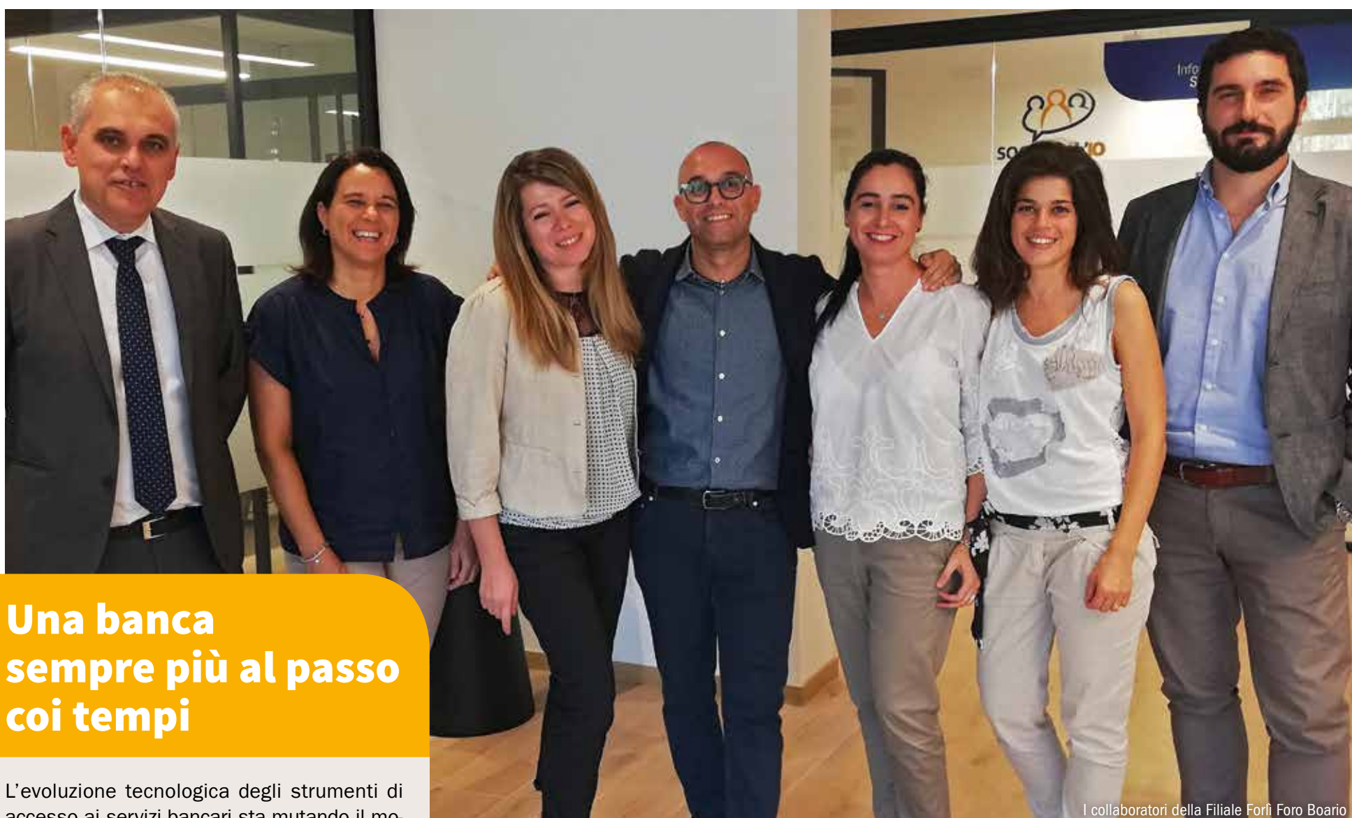
I collaboratori della Filiale Forlì Foro Boario