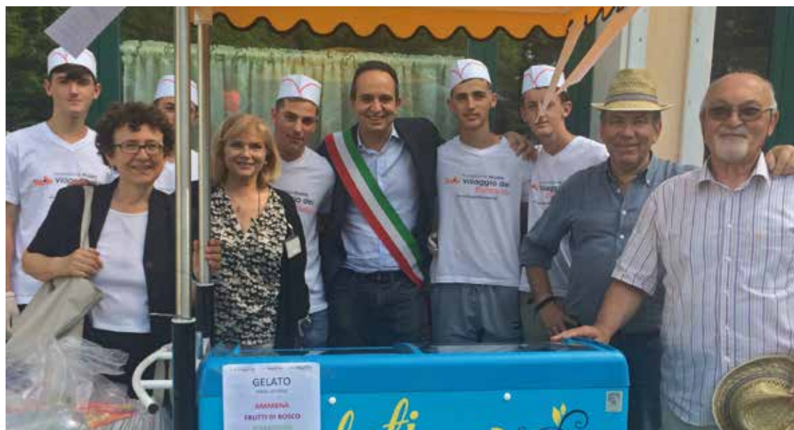
L'inaugurazione di “Villagelato” il 24 agosto 2018

teria artigianale di Ponte Nuovo a Ravenna con il nome di “Villagelato”. La gelateria è un nuovo servizio per il territorio che ha il duplice obiettivo di fornire un'occasione di lavoro ai giovani residenti all'interno del Villaggio, e di offrire una nuova gustosa opportunità ai cittadini. Il gelato che i ragazzi producono e propongono alla cittadinanza è totalmente artigianale e realizzato con prodotti freschi raccolti direttamente dall'orto del Villaggio, come fragole, nocciole, angurie, ecc. Le aperture estive della gelateria sono state un'esperienza molto positiva per tutti i ragazzi coinvolti, e nel complesso l'attività formativa correlata ha dato ottimo riscontro. Il progetto proseguirà