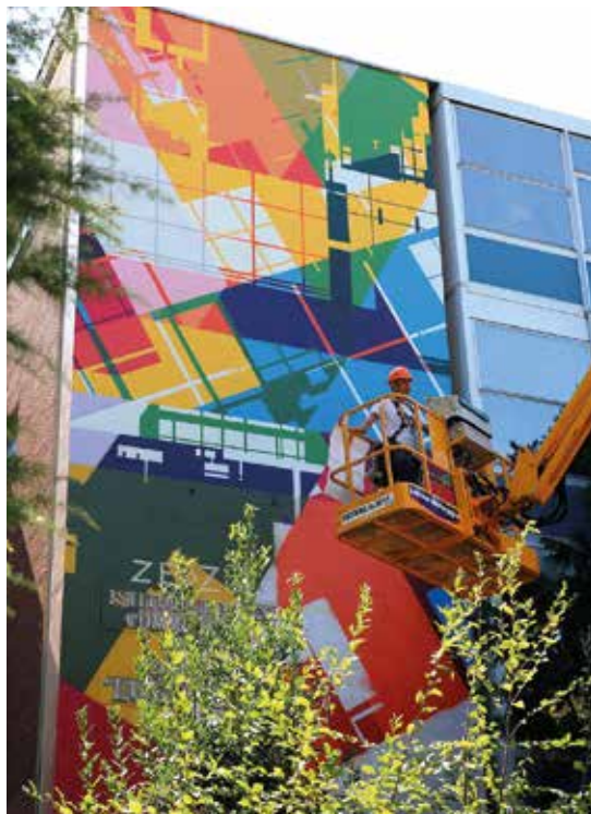
L'artista Zedz, proveniente dai Paesi Bassi, dipinge la superficie frontale dell'Istituto Tecnico Paolini.

“Lavorare all'interno del polo scolastico significa avere particolare attenzione per le tematiche riguardanti la cultura e l'immaginazione dei ragazzi che giornalmente frequentano questi spazi - ha aggiunto il