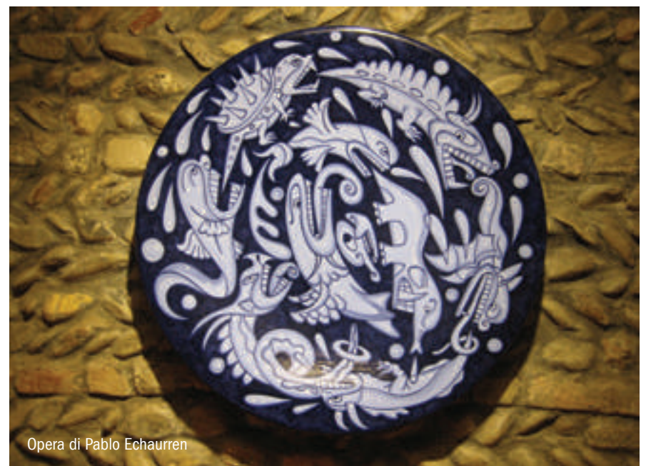
Opera di Pablo Echaurren

Spazi per fare vivere la cultura: le filiali e le sale della nostra Banca sono anche questo. E' successo in tante occasioni nello scorso mese di settembre, a partire da Faenza passando per Fusignano ed arrivando fino ad Imola.