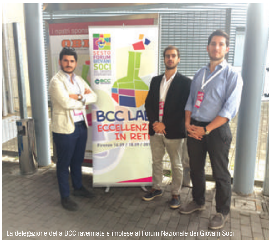
La delegazione della BCC ravennate e imolese al Forum Nazionale dei Giovani Soci

“TORNIAMO A CASA CON TANTE IDEE E LA CONSAPEVOLEZZA DI ESSERE STATI TESTIMONI DI UN INCONTRO TRA RAGAZZI UNITI DA UN FINE COMUNE E DALLA VOGLIA DI SPENDERSI PER IL PROPRIO TERRITORIO”