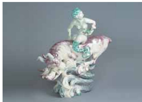
La scultura fu realizzata presso l'importante manifattura Bing & Groendahl di Copenhagen (Danimarca) dall'artista Jean René Gauguin. Figlio del grande pittore Paul: restano famose le sculture di sportivi, a dimensioni naturali, che realizzò per i giochi olimpici, in particolare quelli di Parigi del 1924. La scultura, in grès, smalto bianco e decorazioni in colore, raffigura un toro marino su onde, cavalcato da una fanciulla-sirena che tiene in mano un pesce.

Internazionale delle Ceramiche. Si tratta di una raccolta di artisti celebrati (come Antonio Recalcati, Bruno Bagnoli, Pablo Echaurren), affiancata a quella di altri meno noti, ma che hanno trovato nelle varie edizioni del Concorso Internazionale della Ceramica d'Arte Contemporanea di Faenza un adeguato sipario di proposta e di confronto, in un contesto internazionale. Argillà si è snodata lungo le strade del Centro Storico di Faenza, con 143 ceramisti che hanno esposto le loro