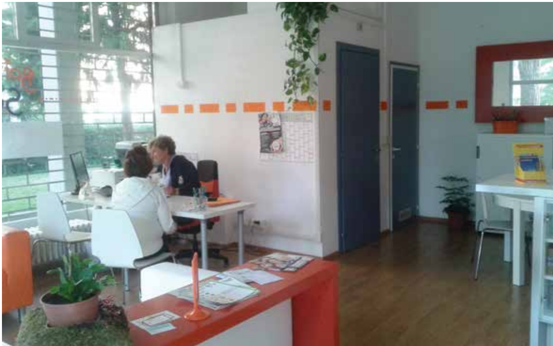
Nella foto l'interno della sede di Ravenna della Bottega dei Servizi

Ho bisogno di aiuto per le pulizie domestiche, cosa potete offrirmi? Per le pulizie abbiamo sia un servizio di colf oppure possiamo offrire anche un servizio di pulizie domestiche ordinarie realizzato dalle cooperative del territorio.