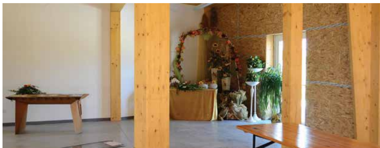
L'ingresso di Kirecò a Ravenna in via Romea 144