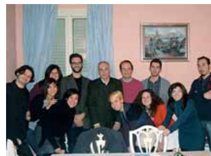
Incontro con un gruppo di ragazzi del Progetto Leonardo al loro rientro in Italia.

Dietro al valore economico delle borse di studio destinate a coprire i costi di viaggio e di alloggio, c'è un lavoro attento di personalizzazione e