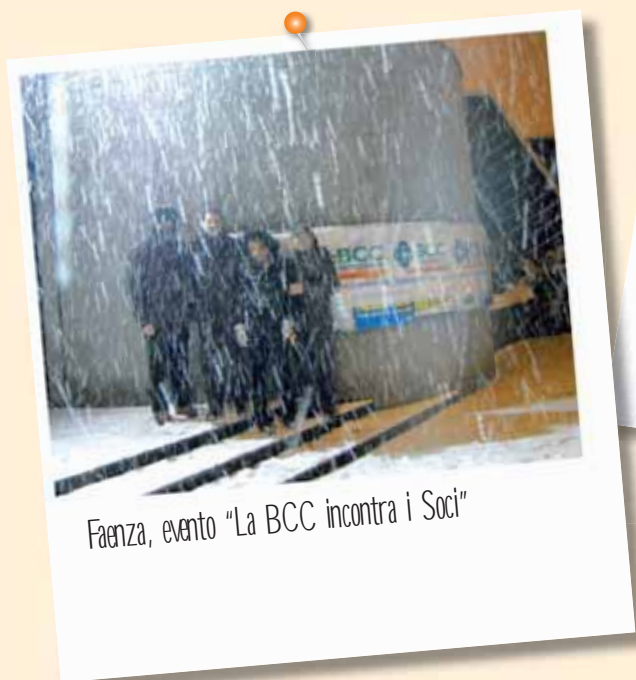
Faenza, evento "La BCC incontra i Soci"