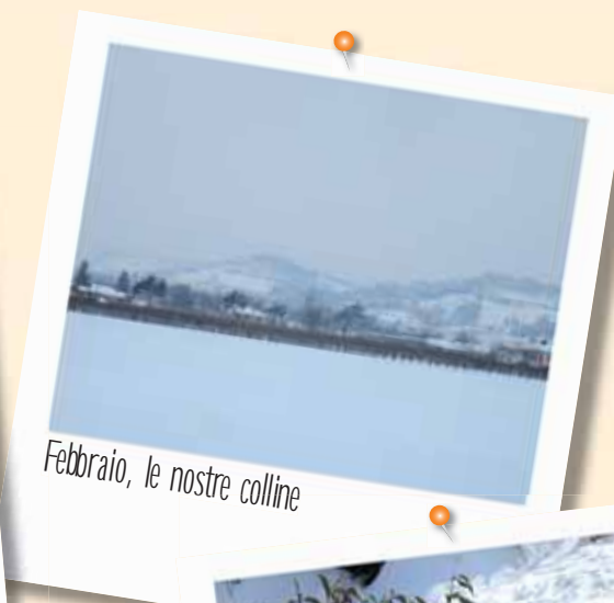
Febbraio, le nostre colline