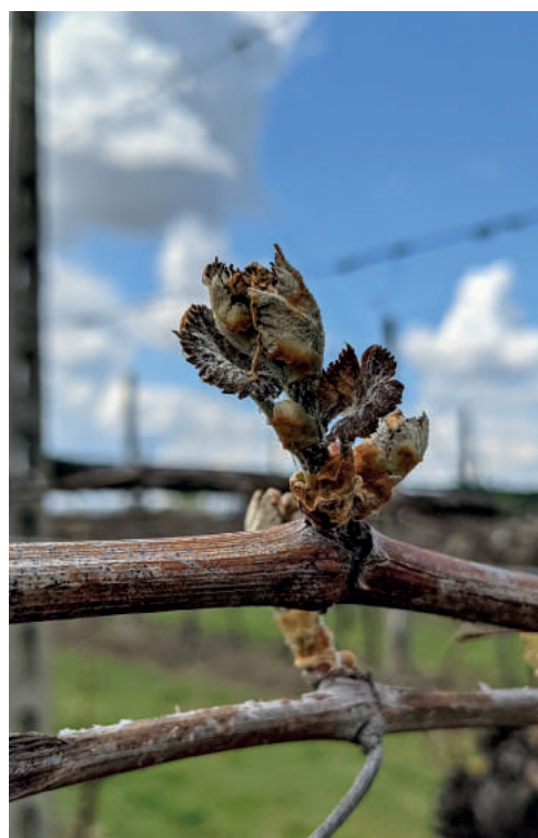
Prima e dopo: i danni da gelo su un germoglio nelle nostre campagne

Ad inizio aprile gelate tardive e brinate hanno interessato porzioni ampie del nostro territorio, con temperature che hanno fatto segnare ai termometri tra il -2° ed il -6° in tutta l'area ravennate, ma anche nell'imolese, forlivese e cesenate, si sono attestati su valori sotto lo zero in aperta campagna. Come ben documentato dalle immagini pubblicate dai consorzi Condifesa (foto a fianco) le colture sono state seriamente compromesse. Quasi azzerate le produzioni di albicocche, danni molto importanti anche sulle fioriture delle pere con produzioni che risultano compromesse, anche le susine sono state molto colpite, danneggiati anche vitigni e actinidia.