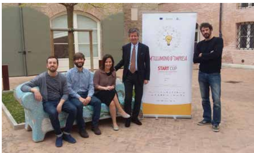
Sopra l'arrivo del barcamper a Faenza, sotto i candidati startupper a Ravenna.