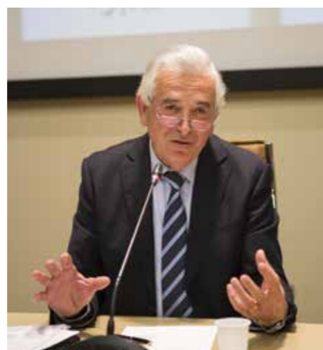
Il Presidente Secondo Ricci

"La cooperativa che pensa solo ai suoi affari e non genera valore aggiunto per le persone dei Soci e per la loro comunità locale non è più una cooperativa" Giovanni Dalle Fabbriche