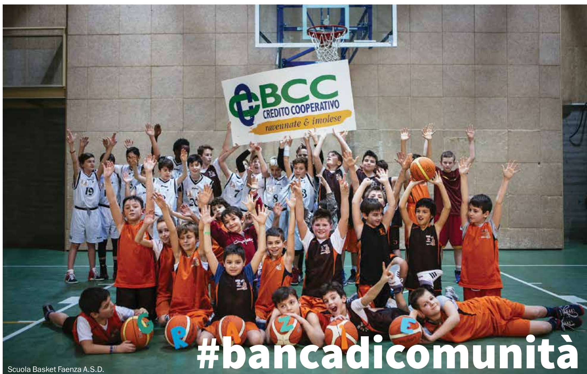
Scuola Basket Faenza A.S.D.

“La Società si distingue per il proprio orientamento sociale e per la scelta di costruire il bene comune.” Così recita l’articolo 2 del nostro Statuto Sociale. Ogni anno la Banca assolve a questo impegno destinando risorse al territorio, per la promozione e lo sviluppo della comunità. Nel 2016 la Banca ha erogato circa 1.100.000 euro a fronte del Progetto “Insieme per il Territorio” e di 936 richieste di contributi di beneficenza e sponsorizzazione, a sostegno di molteplici progetti legati alla cultura, ai giovani, allo sport, alla scuola, agli anziani, alla sanità e all’associazionismo in generale. Anche l’Assemblea dei Soci del 6 maggio 2017 destinerà una quota dell’utile di esercizio al Fondo Beneficenza e Mutualità, dando continuità a questo orientamento.