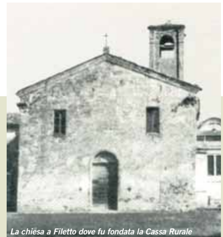
La chiesa a Filetto dove fu fondata la Cassa Rurale

Di certo non mi pento di avere scelto questa strada,