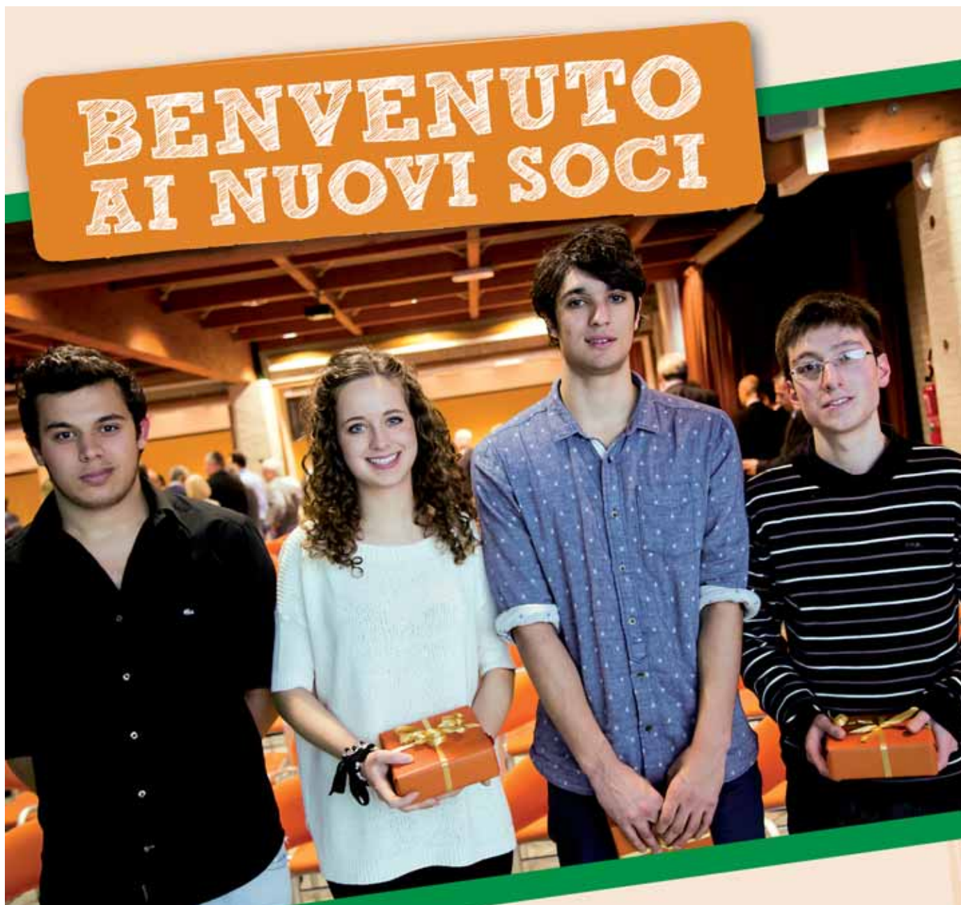
Nella foto: Cervia, in occasione della festa di Benvenuto ai nuovi Soci 2012 sono stati premiati i quattro Soci più giovani entrati nella nostra cooperativa di credito