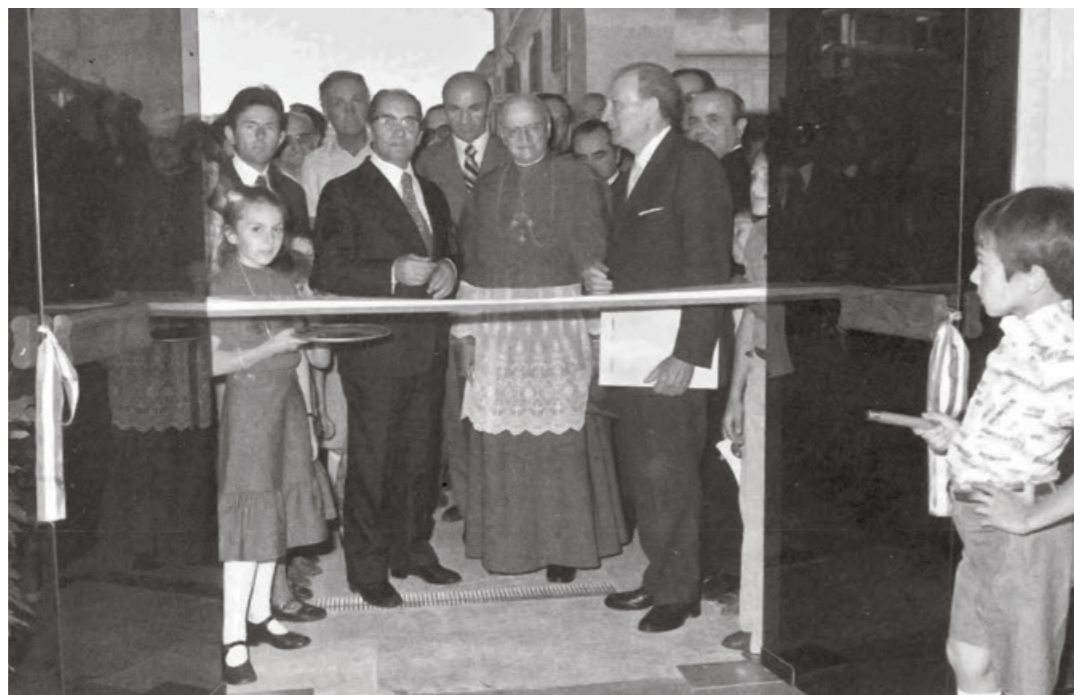
A sinistra l'inaugurazione della sede di Russi (30 giugno 1974). Sotto statuti, regolamenti e relazioni delle Casse Rurali nei primi decenni del Novecento

Questo itinerario ha avuto inizio proprio a Russi quando, il 19 settembre del lontano 1898, fu costituita la prima Cassa Rurale del nostro territorio ad opera di un gruppo di sacerdoti, tra cui don Ferdinando Benelli e don Mauro Tanesini, sulla spinta dell'enciclica Rerum Novarum di Leone XIII, che segnò una svolta importante nell'impegno sociale dei cattolici, in quanto contribuì a risvegliare le coscienze di fronte ai grossi problemi economici della fine dell'Ottocento. Questa finalità fu perseguita anche attraverso la costituzione di piccoli istituti bancari denominati Casse Rurali che avevano il compito di rac-