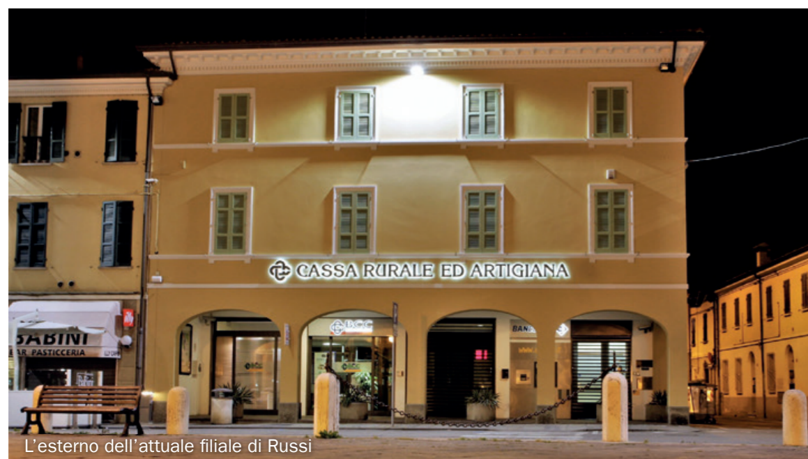
L'esterno dell'attuale filiale di Russi