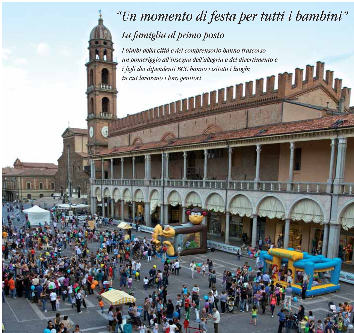
Nella foto: 5 giugno 2013, “In ufficio con mamma e papà” in piazza a Faenza.

I bimbi della città e del comprensorio hanno trascorso un pomeriggio all'insegna dell'allegria e del divertimento e i figli dei dipendenti BCC hanno visitato i luoghi in cui lavorano i loro genitori