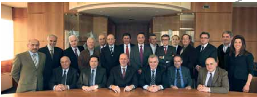
Il Consiglio di Amministrazione, il Collegio Sindacale e la Direzione della BCC ravennate e imolese.