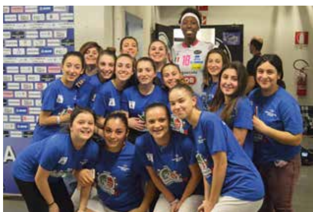
Sopra un momento della conferenza stampa per il lancio dell'iniziativa. Sotto il gruppo che ha partecipato alle finali di coppa italia