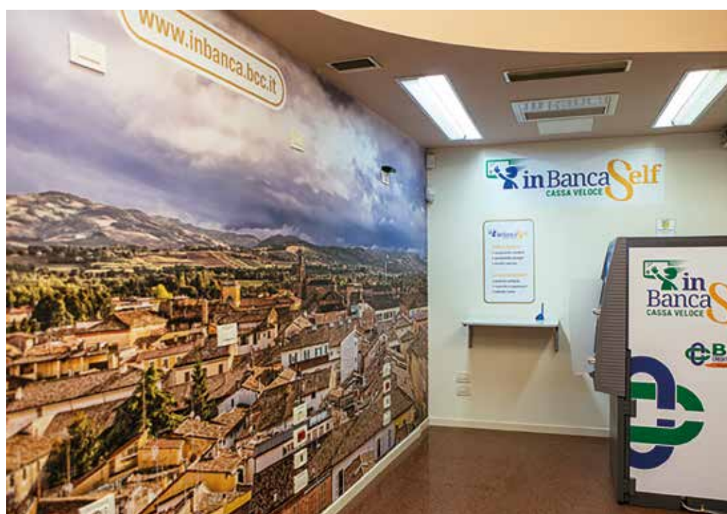
L'Area Self esterna della Filiale Faenza Sede è aperta tutti i giorni dalle ore 6.00 alle ore 23.00.

Presso le aree self sono attive strutture di erogazione del contante che consentono all'utente di effettuare in autonomia anche operazioni evolute tradizionalmente effettuate allo sportello (come ad esempio versamento contanti, versamento assegni, ricarica di carte prepagate), in una fascia oraria estesa anche fino a 24 ore al giorno 7 giorni su 7.