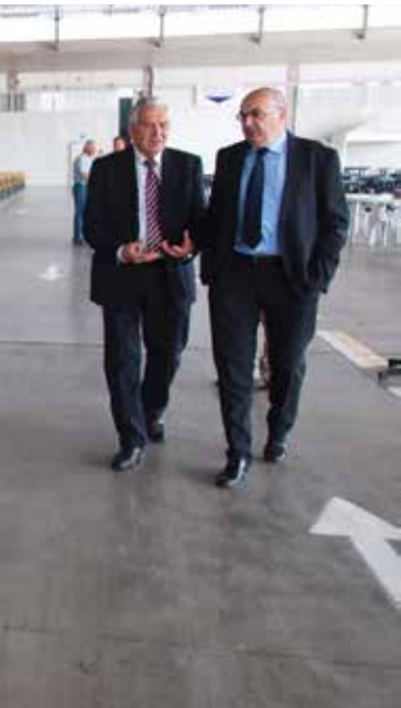
ca Messa ad Agrintesa domenica 31