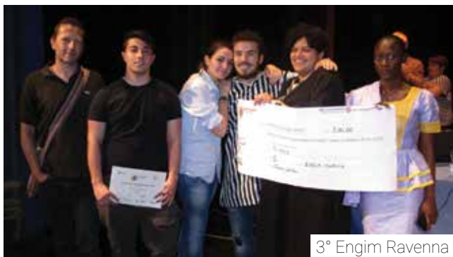
3° Engim Ravenna

E' stata la 3° A Rim dell'Itc Oriani di Faenza ad aggiudicarsi la 15esima edizione di Cooperiamo a scuola, il progetto di educazione cooperativa promosso dal coordinamento delle tre centrali cooperative della provincia di Ravenna. Subito dietro i ragazzi della 4° B MM dell'Itip Bucci di Faenza mentre, sul terzo gradino del podio, è salita la 3° Engim di Ravenna. Premi speciali alla 4° C dell'Olivetti di Ravenna e alla 4° A dell'Artusi di Riolo Terme. Il progetto è realizzato dalle operatrici delle cooperative RicercAzione e Libra. Finanziamenti: Camera di Commercio di Ravenna, Fondazione del Monte di Bologna e Ravenna, Bcc ravennate e imolese, Assicoop e Regione Emilia Romagna. (l.r)