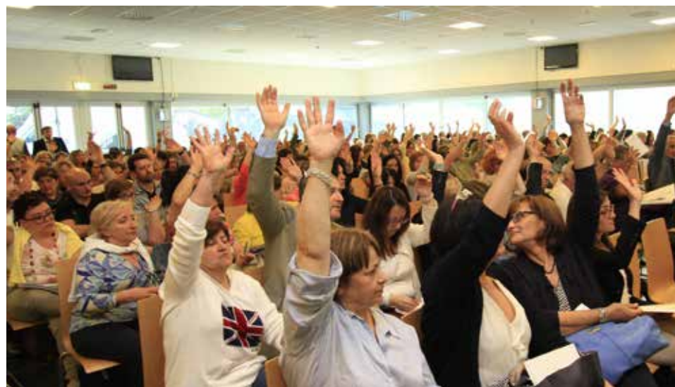
Assemblea 2015 di Gemos. I soci presenti (315) approvano all'unanimità il bilancio presentato dal Consiglio d'amministrazione.

ne con la presa in gestione di un servizio bar all'interno di un complesso aziendale Fca in Serbia. Per il resto il 2014 è stato un anno senza grossi interventi e ciò ci ha permesso di concentrarci sull'efficiamento dell'organizzazione interna”.