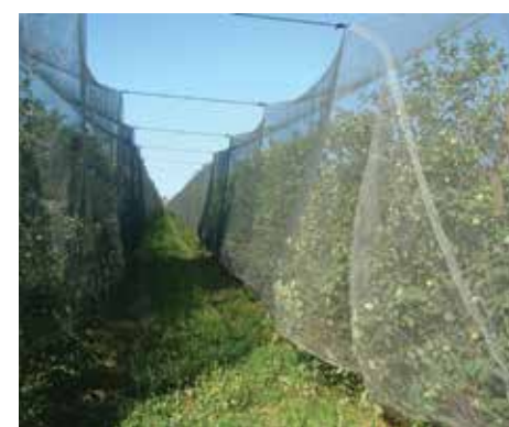
Reti antinsetto per la difesa delle piante

L'attività di Agrisol si confronta con problematiche che rendono ogni annata diversa dall'altra. La prima variabile è quella climatica: molte piogge intense ad inizio anno e ripresa vegetativa delle fruttifere più tarda mediamente di 10-12 giorni sul 2014. Inoltre si è avuto un comportamento molto altalenante delle temperature, nell'escursione termica di brevi periodi, con giorni molto freddi e altri molto caldi. A questo si aggiungono i cambiamenti in materia di agrofarmaci: modifiche della legislatura, adempimenti sul Piano d'azione nazionale, riduzione delle