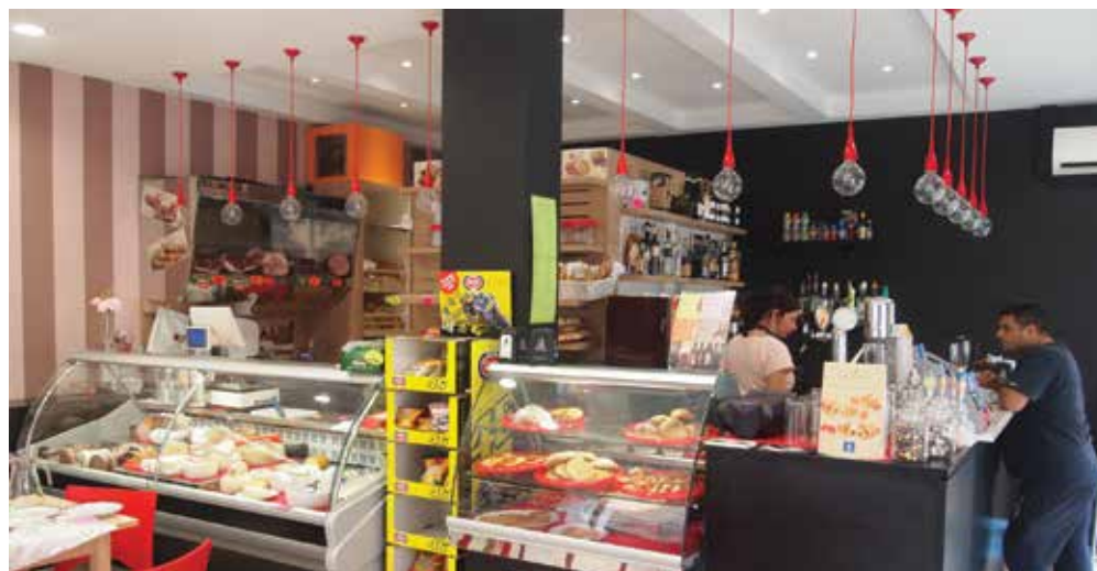
In alto l'interno dell'emporio Centomani con il bar e banco frigo. In basso a sinistra l'esterno in corso Garibaldi a Lugo