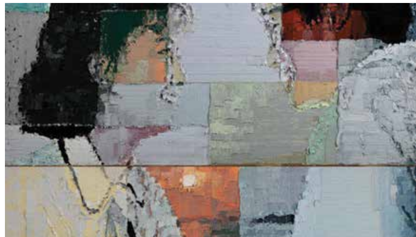
Sopra un'opera di Li Songsong e in basso a sinistra "Il Genio delle acque"

Dal 22 maggio il Mambo di Bologna ospita la prima personale italiana di Li Songsong, uno tra i maggiori artisti della nuova scena cinese. L'esposizione, "Historical Materialism", propone una rilevante selezione di lavori allestiti negli spazi della Sala delle Ciminiere. Nelle sue opere Li Songsong si appropria di immagini relative a eventi storici o di cronaca, per dar vita a composizioni pittoriche che paiono rievocare accadimenti per lo più rimossi nella moderna condizione del suo Paese. A seguito di un processo di scomposizione e ricomposizione