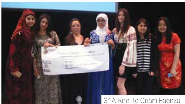
3° A Rim Itc Oriani Faenza