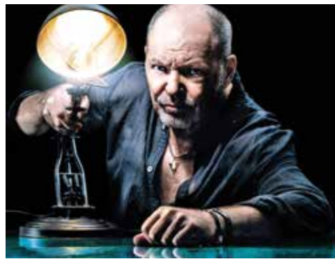
Vasco Rossi il 22 a Bologna

Ravenna Arteficerie Almagià Un instant entre deux instants musica / Ore 21 / 0544 249211