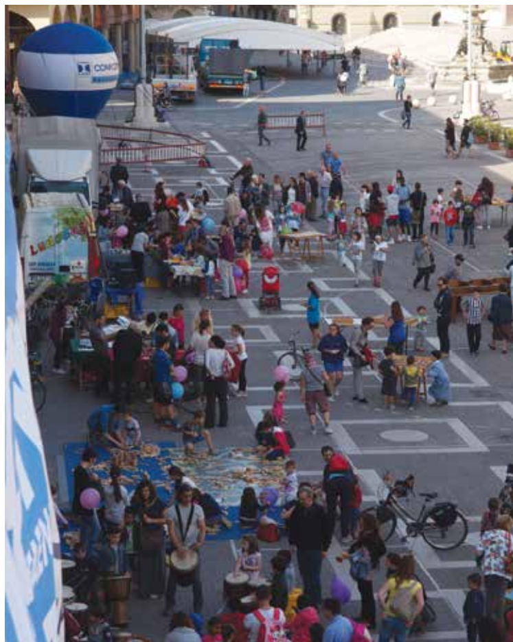
Il Giocacittà in piazza del Popolo a Faenza