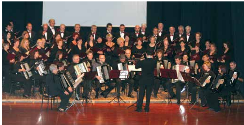
Il Gruppo corale strumentale Laura Benizzi

Il ricavato dell'iniziativa verrà devoluto all'associazione Cosmohelp di Faenza, la cui mission è dare la possibilità a bambini provenienti da Paesi in difficoltà e affetti da gravi patologie di venire in Italia per curarsi. (g.r.)