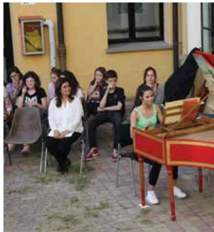
Un momento dell'open day che si è svolto il 17 maggio a Bagnacavallo