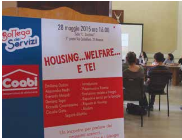
Sopra il convegno "Housing... welfare... e te!" organizzato dalle cooperative Bottega dei Servizi e Coobi con l'obiettivo di analizzare i bisogni emergenti riguardo la casa e i servizi alla persona all'interno dei nuovi scenari socio-economici. A destra l'incontro "Well-fare: cooperazione tra lavoro, comunità e servizi al cittadino". Tra i relatori Felice Scalvini, assessore ai Servizi sociali Comune di Brescia, Elisabetta Gualmini, assessore regionale al Welfare e Paolo Venturi, direttore Aicon