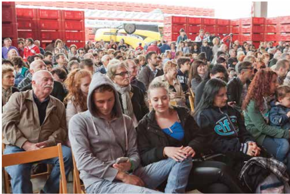
Sopra e a destra tre momenti della Festa della Cooperazione di Bagnacavallo