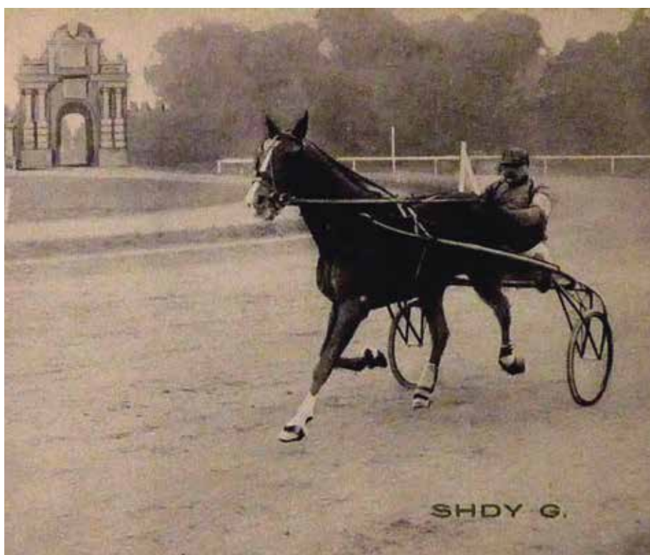
Sopra Shady G. vincitore del Campionato europeo di trotto svoltosi il 29 agosto del 1909; a destra il manifesto del 1908