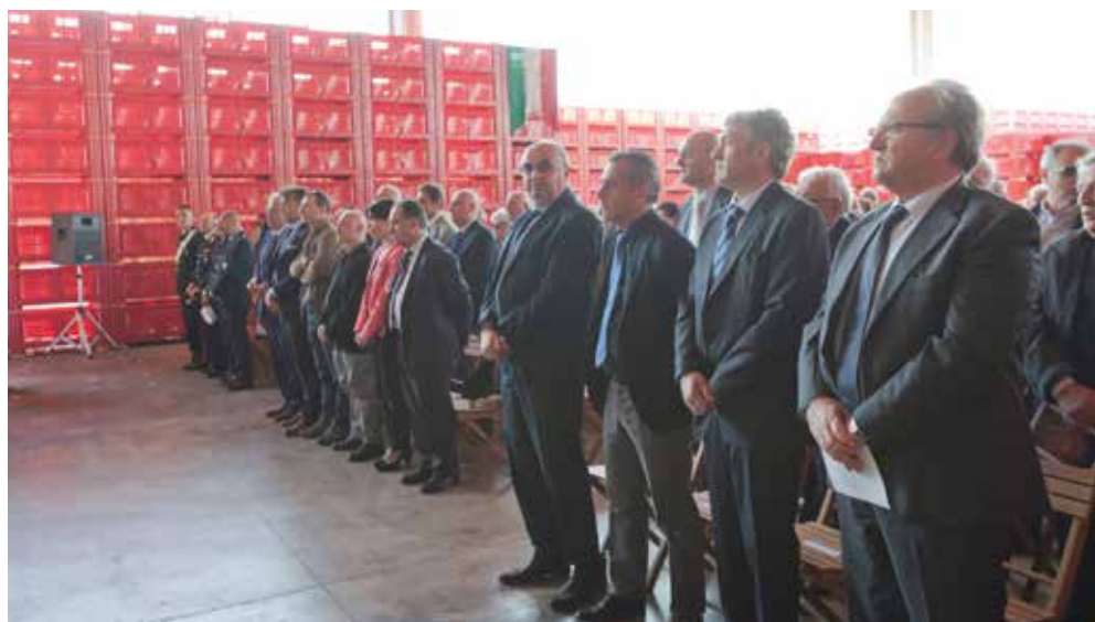
Un'immagine della partecipata Messa della Festa della Cooperazione di Bagnacavallo