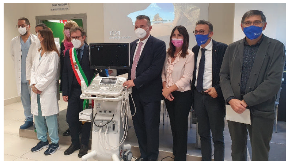
La consegna dell'ecografo alla presenza delle autorità e della direzione sanitaria dell'ospedale di Faenza

L'associazione “Fiori D'Acciaio” ha donato un ecografo di ultima generazione, al Servizio di Senologia dell'ospedale di Faenza, che sarà destinato alle attività chirurgiche, specie tumorali. La neoplasia della mammella rappresenta il tumore più frequente nella popolazione femminile, con un tasso di incidenza attuale di 124 casi ogni 100.000 abitanti/anno in Emilia-Romagna. È pertanto indispensabile sensibilizzare le donne a sottoporsi al programma di screening che nei nostri territori viene svolto presso i Centri di Prevenzione Oncologica presenti sui tre Presidi di Faenza, Lugo e Ravenna. Ciò consente di poter effettuare una diagnosi precoce e trattare la malattia negli stadi iniziali. L'ecografo, donato anche grazie al contributo di 15.000 euro de LA BCC, è uno strumento indispensabile per l'anestesista, per il chirurgo in sala operatoria nonché durante la degenza post-operatoria, in quanto consente di eseguire trattamenti anestesioloci regionali finalizzati a ridurre il dolore post-operatorio e l'utilizzo di farmaci anestesioloci nel peri-operatorio.