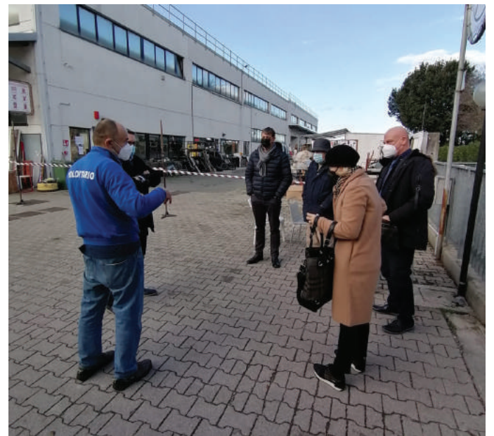
Alcuni rappresentanti del Comitato Locale di Forlì in visita alla sede dell'Associazione che si occupa di contrasto alla povertà in Italia e nel mondo

I membri del Comitato Locale di Forlì hanno fatto visita nello scorso mese di novembre alla sede operativa del "Comitato per la lotta contro la fame nel mondo", una delle importanti realtà associative del territorio forlivese sostenute dalla Banca. Un'occasione per toccare con mano le molteplici attività di riciclo e recupero quotidianamente svolte dall'associazione, nata nel 1963, per finanziarie le missioni internazionali ma anche per contrastare le povertà e le nascenti fragilità locali acuite dalla pandemia.