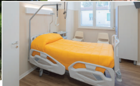
A sinistra alcuni ospiti del centro si mettono in gioco per la campagna di crowdfunding. Nella altre foto l'esterno e un interno della struttura residenziale

“Vogliamo regalare nuovi letti e sollevatori a soffitto ai nostri ospiti: Aiutaci anche tu!” LA BCC ha prontamente accolto l'invito a sostenere la campagna di crowdfunding promossa dagli operatori del Centro San Pietro, che si trova a San Pietro in Campiano, un piccolo paese nelle campagne ravennati. Il Centro gestito dalla Cooperativa Sociale Terzo Millennio, senza scopo di lucro, ospita 31 persone non autosufficienti, di cui 16 con disabilità acquisita e gravi malattie degenerative e 15 anziani. “Per noi, ognuno di loro è unico