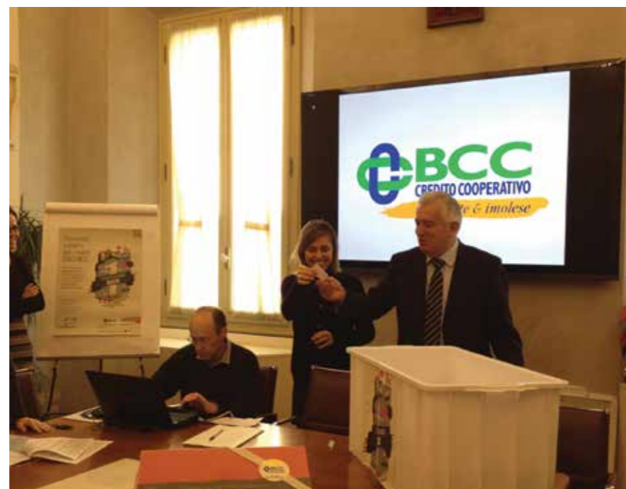
Il Presidente estrae i nominativi dei vincitori alla presenza del funzionario della Camera di Commercio di Ravenna il 7 dicembre 2016