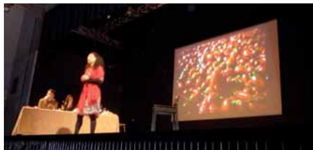
Lo spettacolo a Faenza

Una terra è veramente libera, quando è responsabile!