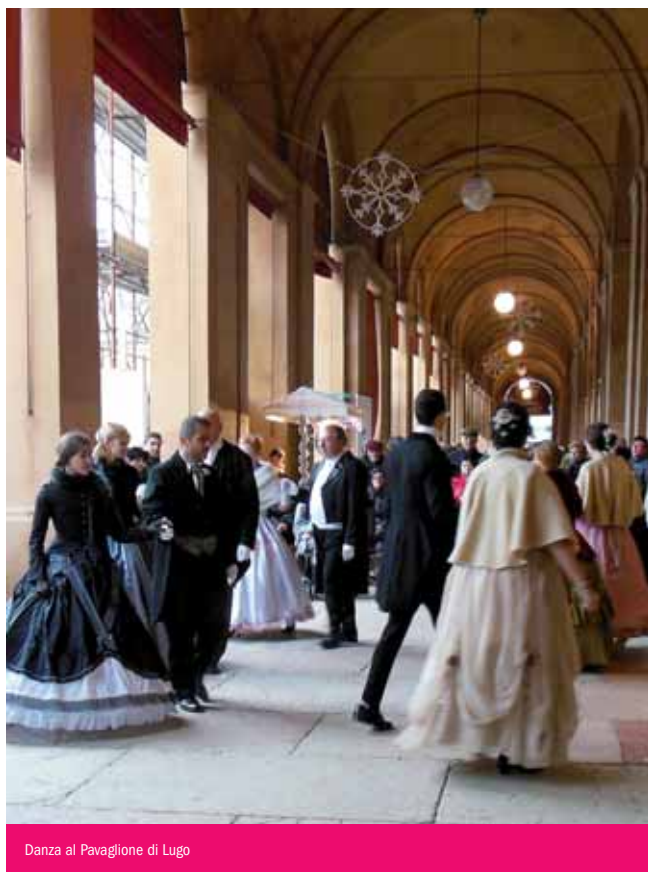
Danza al Pavaglione di Lugo