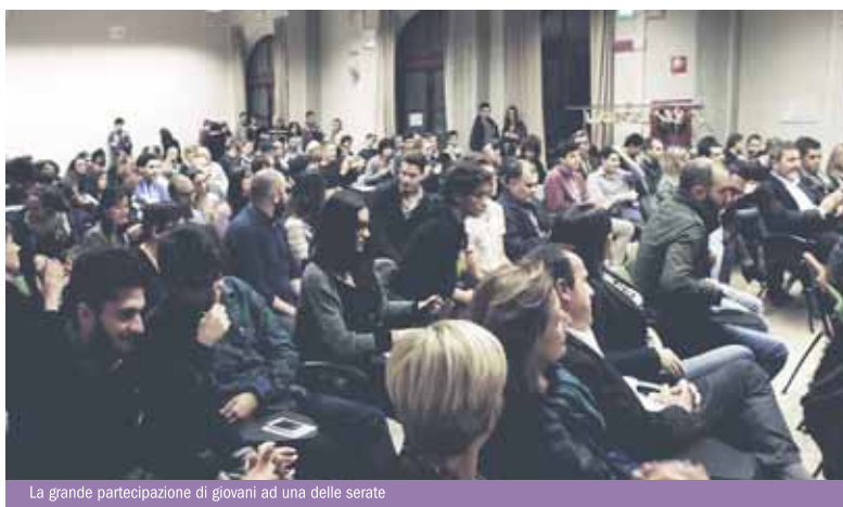
La grande partecipazione di giovani ad una delle serate

Oltre alle realtà già menzionate: Comune di Faenza con Informagiovani, Confcommercio, Confartigianato, Confcooperative, Coldiretti, CNA, Faventia Sales e Pastorale del Lavoro della Diocesi di Faenza - Modigliana. Con