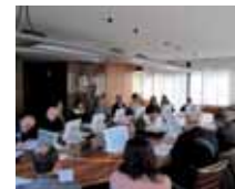
Faenza, la firma dell'accordo tra associazioni non profit ed enti pubblici operanti nel sociale, BCC ravennate e imolese e Fondazione Dalle Fabbriche per la concessione di finanziamenti di micro-credito etico sociale

Al 1 ottobre 2014, risultano in essere 43 prestiti, per un debito residuo di 162.800 euro, mentre dalla sottoscrizione della convenzione sono stati erogati 63 prestiti per un totale di 321.000 Euro.