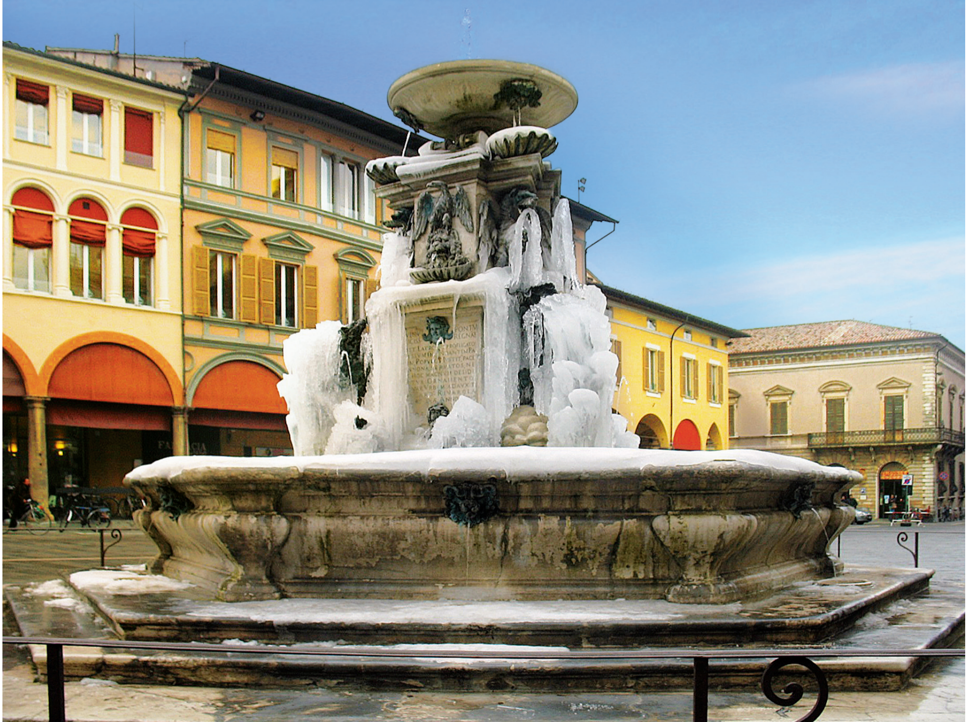
Foto: Faenza Fontana monumentale. Sullo sfondo Sede Centrale Credito Cooperativo ravennate e imolese.