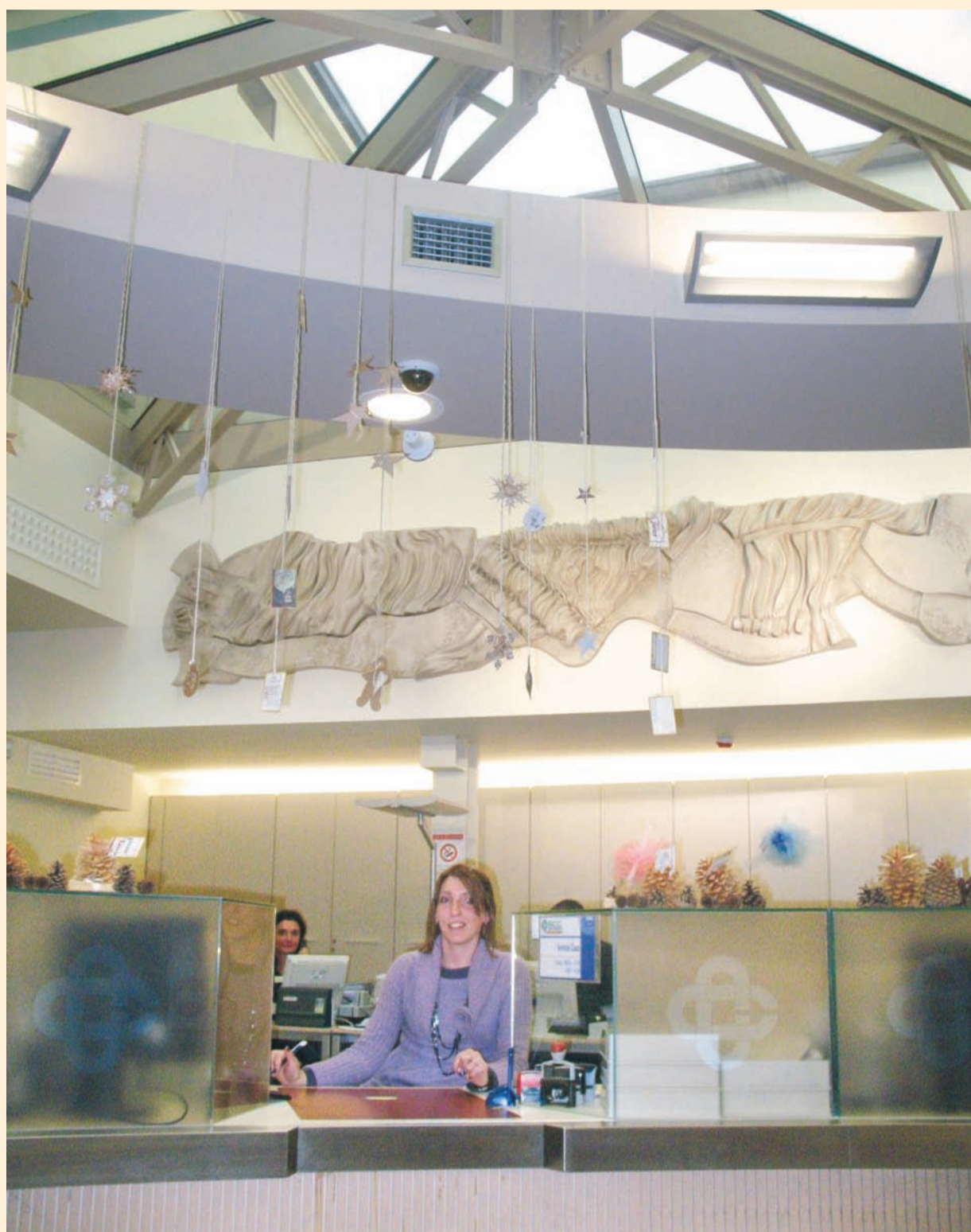
Foto: I nuovi sportelli della Filiale Sede di Faenza

Invitiamo i nostri clienti e soci che hanno ricordi e curiosità da raccontare sulla nostra banca di ieri e di oggi, a scrivere a BCC Ravennate e imolese, Ufficio Soci, Piazza della Libertà 14, 48018, Faenza, RA, oppure a redazioneinforma@inbanca.bcc.it . Le testimonianze saranno trasmesse alla Redazione di BCC Informa.