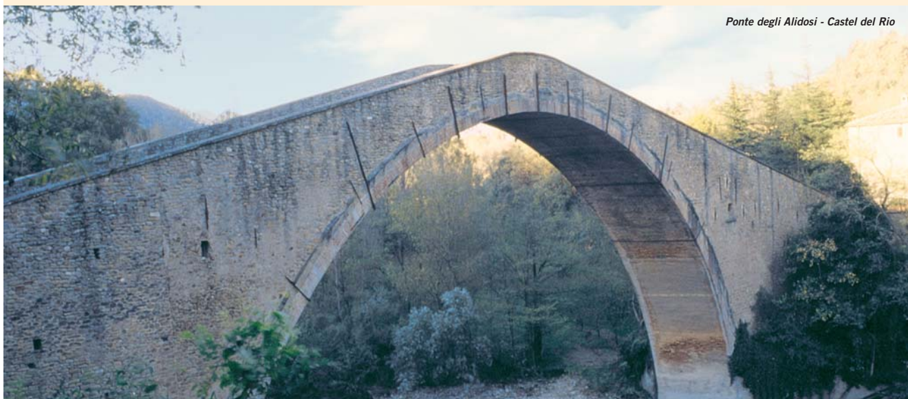
Ponte degli Alidosi - Castel del Rio

All'interno del Ponte degli Alidosi si trovano cinque stanze, probabilmente realizzate per motivi strutturali e poi utilizzate dalle guardie per la riscossione delle gabelle e per rinchiudere eventuali prigionieri. Le stanze sono visitabili e sono state oggi adibite a spazio espositivo, restituendo così al Ponte il suo valore simbolico di trasmissione di storia e cultura.