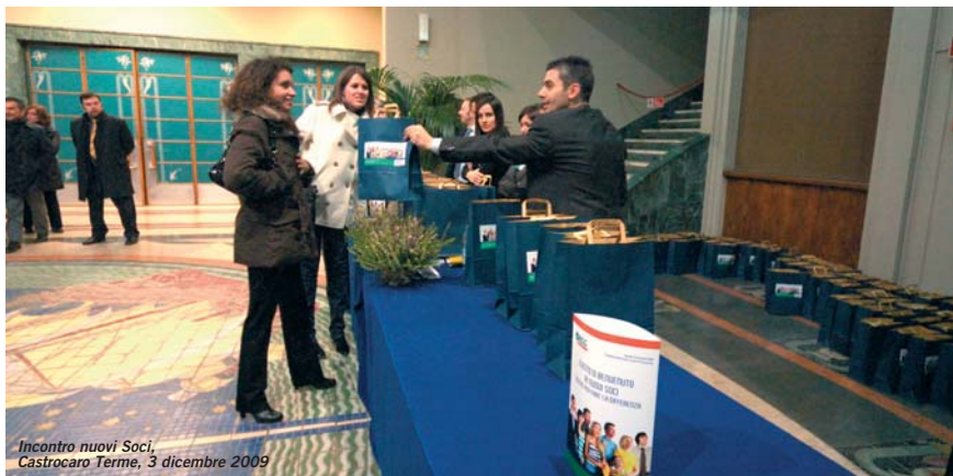
Incontro nuovi Soci, Castrocaro Terme, 3 dicembre 2009

I giovani sono il nostro futuro. Per una BCC come la nostra lo sono ancora di più. Sono tanti, infatti, i giovani ai quali ci rivolgiamo: clienti, Soci, dipendenti. È ancora valido per loro il modello cooperativo, possiamo proporlo come modello vincente?