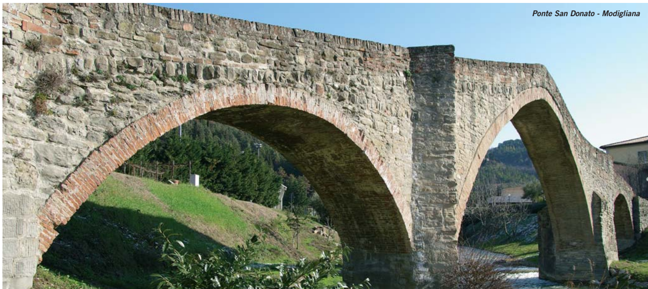
Ponte San Donato - Modigliana

Modigliana e Castel Del Rio sono due piccole realtà in cui il Credito Cooperativo ravennate e imolese ha attecchito ormai da anni.