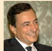
Mario Draghi, Governatore della Banca d'Italia

Noi cerchiamo di fare bene il nostro mestiere, di essere vicini alle famiglie e alle imprese, sia in tempi di crisi che di sviluppo. A un giovane che si avvicina al mondo delle banche proponiamo semplicità e serietà: ci mettiamo la nostra faccia e quella dei nostri collaboratori. Proponiamo soluzioni concrete e assistiamo il cliente sempre: prima, durante e dopo la stipula di un contratto. Se questo è un modello vincente, non sta a noi dirlo, lo diranno i fatti.