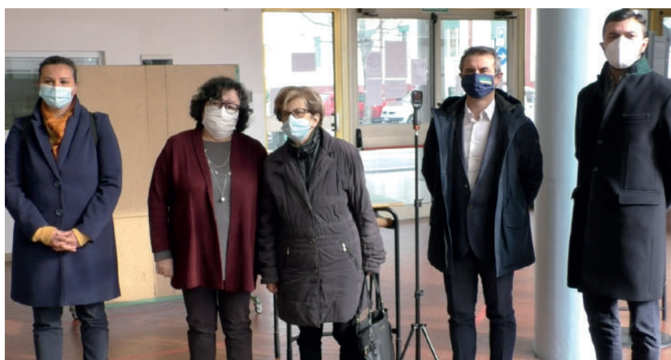
La consegna delle termocamere e dei termoscanner agli istituti faentini Oriani (sopra) e Bucci (sotto)