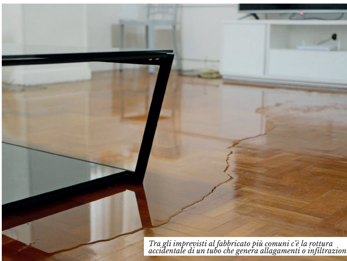
Tra gli imprevisti al fabbricato più comuni c'è la rottura accidentale di un tubo che genera allagamenti o infiltrazioni

Ancora troppo spesso si assicura l'immobile soltanto perché la "polizza incendio" è obbligatoria per chi contrae un mutuo ipotecario. Si stima che solo un 10% delle case libere da mutuo siano assicurate e questo è un dato che riflette una scarsa propensione ad affidarsi alle assicurazioni in generale. Basti pensare che in Italia, nell'anno 2018, l'incidenza sul PIL dei premi a protezione dei beni, della salute e del patrimonio (esclusa l'auto) è stata pari all'1% rispetto ad una media europea del 2,6%.