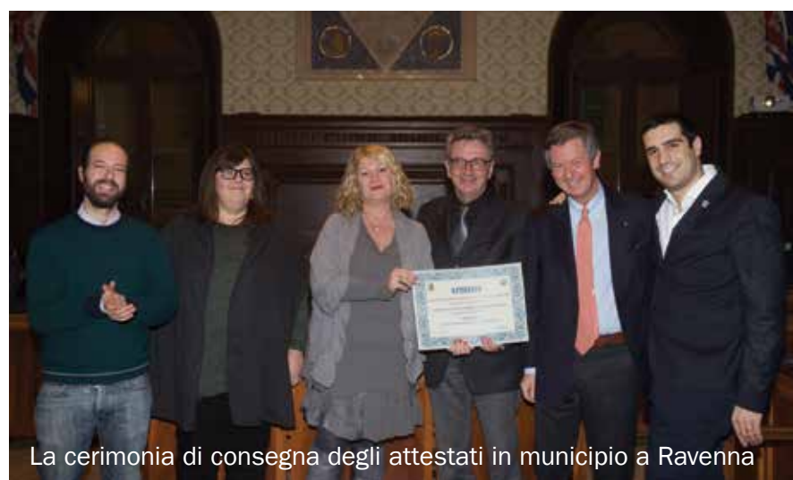
La cerimonia di consegna degli attestati in municipio a Ravenna

Un segno di riconoscimento per l'impegno sociale è stato ricevuto dalla nostra BCC lo scorso 21 dicembre in municipio a Ravenna, in occasione della cerimonia di consegna degli attestati alle aziende che si sono rese protagoniste del progresso del sistema di welfare locale, in collaborazione con l'amministrazione comunale e le associazioni di volontariato, aderendo al progetto "Adotta un progetto sociale, diventa un'azienda solidale". La nostra BCC ha aderito all'edizione 2016 del progetto (giunto alla sesta edizione) adottando tre progetti sociali, per un contributo complessivo di oltre 2.500 euro. Questi i progetti adottati: • "L'AMICO DEL CUORE", promosso dalla FONDAZIONE VILLAGGIO DEL FANCIULLO, per l'acquisto di un defibrillatore da collocare presso le strutture del centro; • "LA SCUOLA IN BOTTEGA" promosso dalla COOPERATIVA SOCIALE IL FARO, per far vivere agli studenti di alcuni istituti scolastici ravennati delle esperienze "in bottega" sviluppando attraverso il "learning by doing" i propri talenti e la propria autostima; • "SOSTEGNO A DONNE E BAMBINI VITTIME DI VIOLENZA", promosso dalla "ASSOCIAZIONE LINEA ROSA", per dare assistenza alle donne e minori ospitati nelle case rifugio gestite dall'associazione.