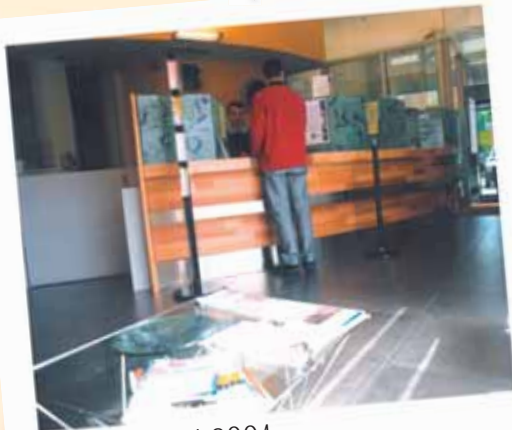
Interno Filiale nel 2004

Sabato 16 febbraio inaugura i nuovi locali e festeggia il decimo anniversario