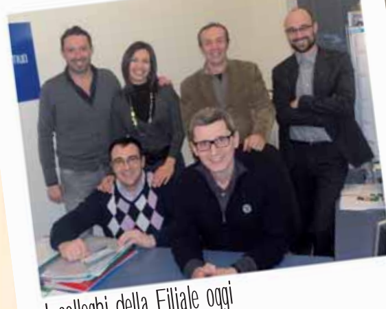
I colleghi della Filiale oggi

I due fumetti sono stati realizzati da Lorenzo Beltrame