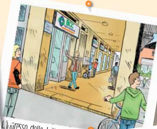
L'ingresso della Filiale