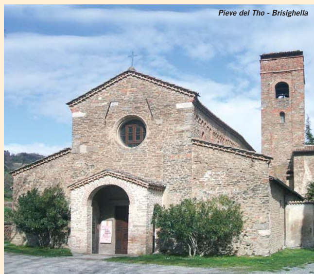
Pieve del Tho - Brisighella

I muri della navata centrale, all'esterno, presentano pregevoli decorazioni, poste fra le monofore. Un miliare romano con iscrizione dedicata ai quattro imperatori della decadenza (anni 376-378), una lapide funeraria in ceramica (XVII sec.), gli affreschi dei secoli XIV-XV-XVI, il capitello corinzio (acquasantiera) del primo secolo d.C., ed altro materiale rinvenuto negli scavi, testimoniano l'antichità di questa "Chiesa-Madre" della valle del Lamone, oggi meta continua di visitatori, attratti dalla sua storia e dalle sue bellezze artistiche.