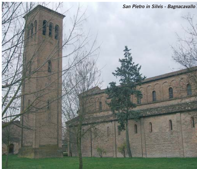
San Pietro in Silvis - Bagnacavallo

Le Pievi, chiese di campagna sparse sul territorio, collocate quasi sempre presso un piccolo agglomerato di case, furono straordinari punti di aggregazione e di forza dell'organizzazione ecclesiastica medievale. Non tutte sono sopravvissute al passare del tempo e alle guerre che hanno attraversato i secoli; identificarle oggi è molto utile per una ricostruzione delle dinamiche storiche degli insediamenti, del paesaggio agrario e del sistema viario del tempo.