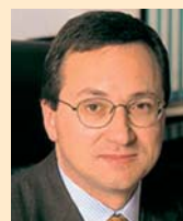
Alessandro Azzi, Presidente di Federcasse

di credito che ci differenzia dalle altre banche è l'appartenenza a una rete, quella delle BCC sul territorio nazionale. Gli studi sulle Piccole e Medie Imprese hanno sempre sottolineato l'importanza dei risultati ottenuti dalla cooperazione nei sistemi produttivi locali ma, come ha recentemente sottolineato il Presidente di Federcasse, Alessandro Azzi (si veda box a lato), oggi serve una ridefinizione della strategia cooperativa. In questo, il sistema delle BCC ha un esempio da proporre in termini di strategia e scelte organizzative. La rete esiste in quanto utile e complementare all'attività delle singole BCC: di fronte alle necessità di sostenere gli investimenti di alcune imprese strategiche del nostro territorio, ICCREA Banca SpA e Banca Agrileasing partecipano assieme alla nostra BCC a operazioni di finanziamento molto importanti per il rilancio dell'economia locale.