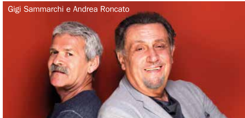
Gigi Sammarchi e Andrea Roncato