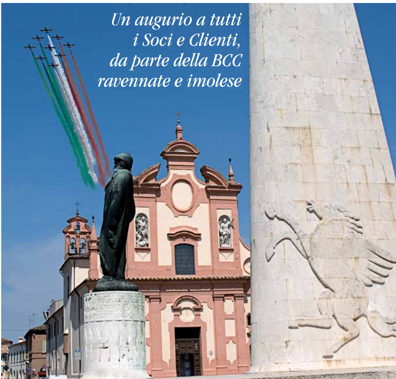
Monumento a Francesco Baracca

Un augurio a tutti i Soci e Clienti, da parte della BCC ravennate e imolese