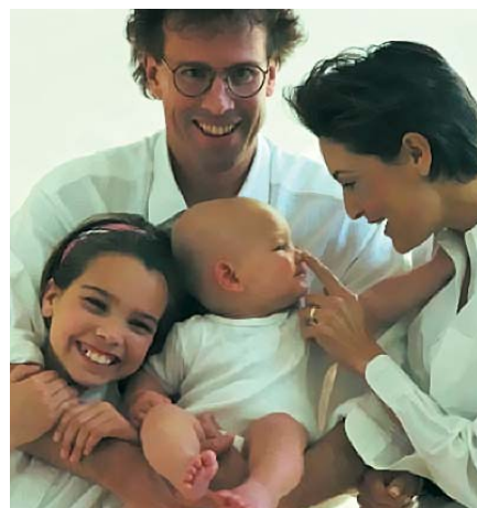
Messaggio pubblicitario con finalità promozionali.

Il consulente BCC vi affiancherà in questa scelta difficile ma fondamentale per il futuro di tutti i lavoratori.