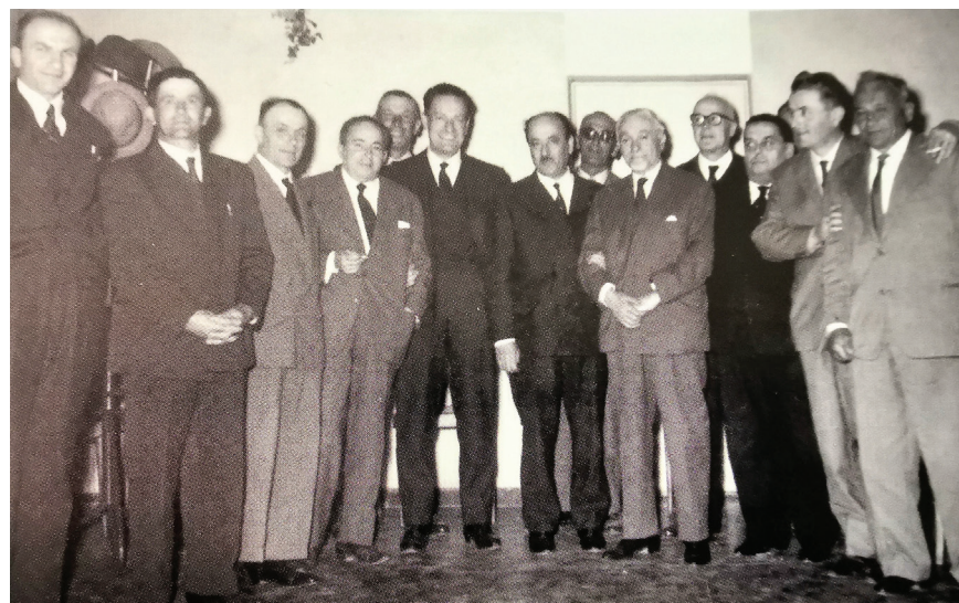
L'onorevole Benigno Zaccagnini con un gruppo di dirigenti e funzionari della Coldiretti di Faenza tra i quali Giovanni Dalle Fabbriche, Giuseppe Albonetti, Cesare Patuelli e il Presidente della Cassa Rurale ed Artigiana di Faenza, Paolo Tamburini. La foto è del 23 aprile 1962.

Nei 39 soci fondatori (28 coltivatori diretti, 7 agricoltori, 1 agronomo, 1 agente di campagna, 1 medico veterinario, 1 artigiano) c'era la consapevolezza di entrare nel solco della grande tradizione sociale dei cattolici faentini impegnati a migliorare le condizioni della gente dei campi e di rispondere in modo concreto e solidale alle esigenze delle aziende contadine di avere l'accesso al credito che altri Istituti bancari "su piazza" erano poco propensi a concedere. Il progetto, al quale aveva a lungo lavorato l'allora segretario locale della Coldiretti Luigi Matteucci, andò in porto grazie alla determinante collaborazione dell'onorevole Benigno Zaccagnini, per tanti anni Presidente della Federa-