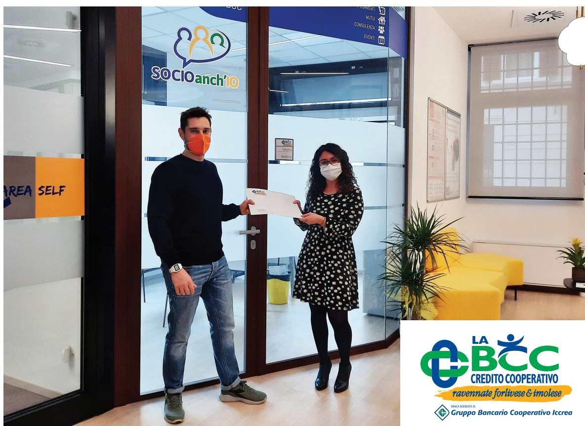
Un Socio consegna la delega presso la Filiale Lugo Via Baracca

L'Assemblea dei Soci rappresenta il momento di incontro che caratterizza la vita della cooperativa, l'espressione più alta della partecipazione dei Soci alla determinazione delle politiche di sviluppo della Banca, per dare concreta attuazione ai principi statutari di promozione economica e sociale del territorio.