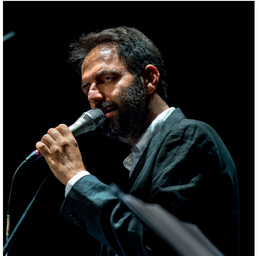
Neri Marcorè