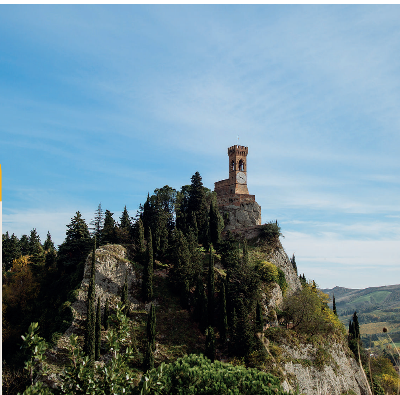
Sarà dedicata ai "Borghi più belli d'Italia" la tappa imolese del tour Innovative Tourism di Iccrea. Nella foto il borgo di Brisighella

Presidente LA BCC ravennate, forlivese e imolese