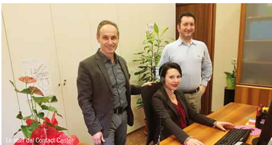
Lo staff del Contact Center

Infine con la sottoscrizione del contratto "InbancaPhone", con il quale viene rilasciato un codice identificativo (pin), sarà possibile richiedere telefonicamente anche informazioni sul saldo del conto corrente, disporre bonifici di importo contenuto (entro i 3.000 Euro) e effettuare ricariche di carte prepagate.