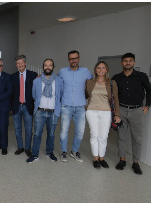
...sentanti del Consorzio Solco, Confcooperati-