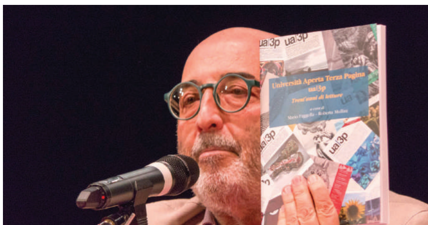
Il libro realizzato tramite il crowdfunding della BCC

acquisisce l'acronimo “ua|3p”. Grazie al crowdfunding realizzato (e cofinanziato) dalla BCC ravennate, forlivese e imolese, “Una guida per esplorare trent'anni di pagine per Imola” è stato possibile realizzare la guida.