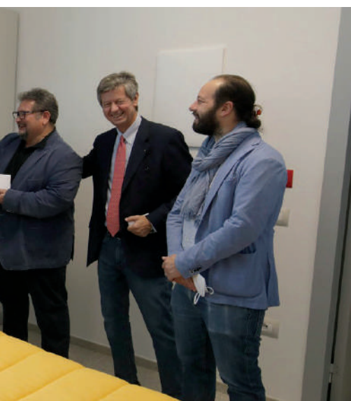
(presidente Consorzio Solco) la donazione