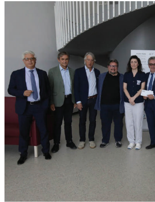
Lo staff della Rosa dei Venti insieme a rappresentanze Romagne e LA BCC

“Alimentare rapporti umani: è questa la sostanza dell'attività dei Comitati Locali e le filiali rappresentano lo specchio della nostra presenza sul territorio; la presenza alle iniziative sostenute sia dei membri del Comitato che dei collaboratori di filiale è il modo migliore per consolidare i rapporti e continuare a dimostrare la nostra volontà di essere ‘differenti’ rispetto ad altre realtà. È il nostro impegno per la promozione della solidarietà e della mutualità”.