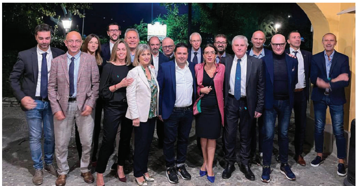
Il team del Servizio Private LA BCC