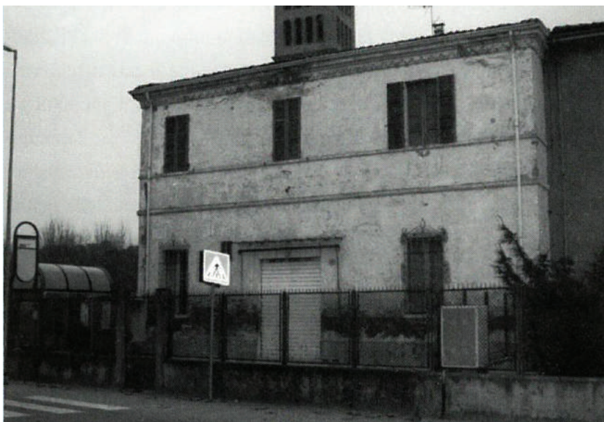
La prima sede della Cassa Rurale di Depositi e Prestiti di San Pancrazio

Per finire, nel 1990 la Cassa Rurale ed Artigiana di Russi e San Pancrazio deliberò la fusione con le Casse Rurali di Mezzano-Villa Filetto e con quella di San Pietro in Trento. Nacque così il 1° dicembre 1990 il Credito Cooperativo-Cassa Rurale ed Artigiana di Ravenna e Russi che diede poi origine nel 1998, unitamente alle Casse di Faenza e Lugo, al Credito Cooperativo Provincia di Ravenna.