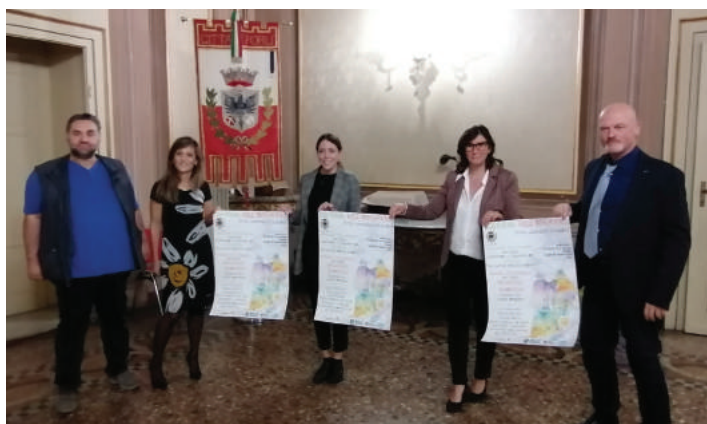
La conferenza stampa di presentazione dell'edizione 2021 del Festival dell'Incontro promosso dalla cooperativa Paolo Babini

Promosso dalla Cooperativa Sociale Paolo Babini, una delle realtà più preziose del mondo della cooperazione forlivese, è tornato il "Festival dell'Incontro", giunto alla sua terza edizione. L'iniziativa, patrocinata dal Comune di Forlì si è svolta lo scorso 15 e 16 ottobre 2021 presso l'auditorium San Giacomo e nello spazio della baracca antistante i Musei San Domenico. Un evento che richiama importanti valori comunitari come l'incontro tra persone, la reciprocità, la solidarietà, la gratuità, il bene comune. Tutti valori che oggi, con la sfida della ripartenza, diventano ancora più attuali ed importanti