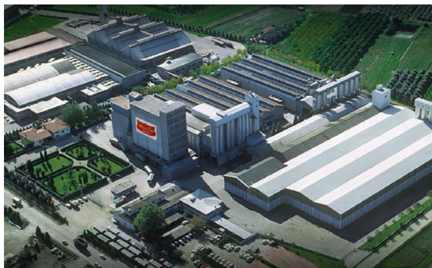
La sede del Gruppo Martini

Obiettivo del progetto è il miglioramento della salubrità e della sostenibilità ambientale nelle produzioni di carni di pollo e suino a marchio Martini con particolare riguardo al benessere animale, alla produzione primaria (riproduzione, allevamento), ai mangimi somministrati, alla trasformazione, alla commercializzazione e alla logistica di carni e prodotti a base di carne. Nello specifico, grazie al finanziamento la Filiera Martini potrà consolidare ed incrementare le produzioni zootecniche di alta qualità "Antibiotic-Free", realizzare nuove strutture di allevamento nonché ampliare le esistenti, coordinare e potenziare l'assistenza tecnica e veterinaria. Grazie a tutti questi interventi la Filiera potrà confermare e rafforzare il posizionamento sui mercati dei prodotti a marchio Martini, player di riferi-