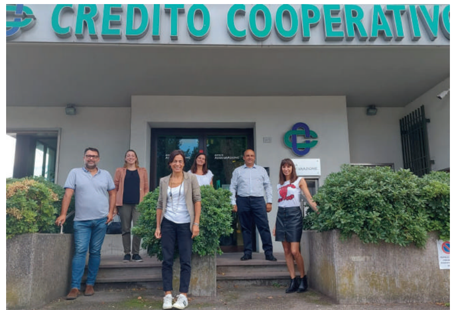
La Filiale LA BCC di San Pancrazio oggi