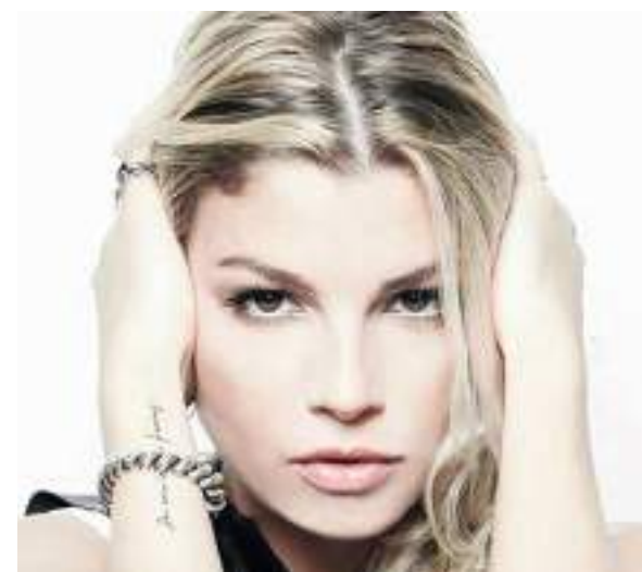
A sinistra Geppi Cucchiari che sarà a Forlì il 6 febbraio con il monologo "Perfetta" e, a destra, Emma Marrone in concerto all'Unipol Arena di Bologna il 23 febbraio