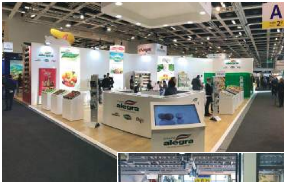
Fruit Logistica 2018