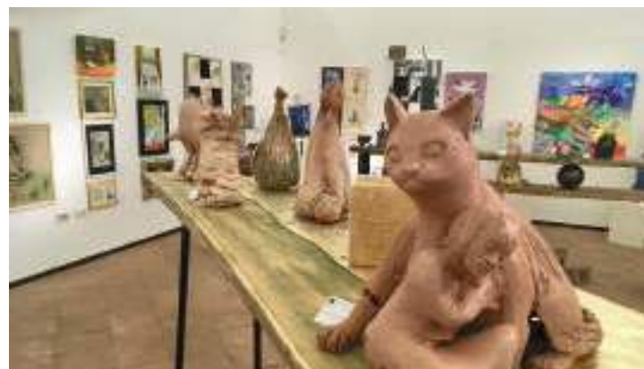
A sinistra La distruzione di Gerusalemme di Francesco Hayez, a destra la collettiva d'arte Artegatto Artefatto

Torna presso la Galleria Comunale d'Arte della Molinella di Faenza l'immane appuntamento annuale con "Artegatto Artefatto", la collettiva d'arte dedicata agli amici felini - curata da Ceramiche Mirta Morigi assieme ad Ente Ceramica - giunta quest'anno all'edizione numero