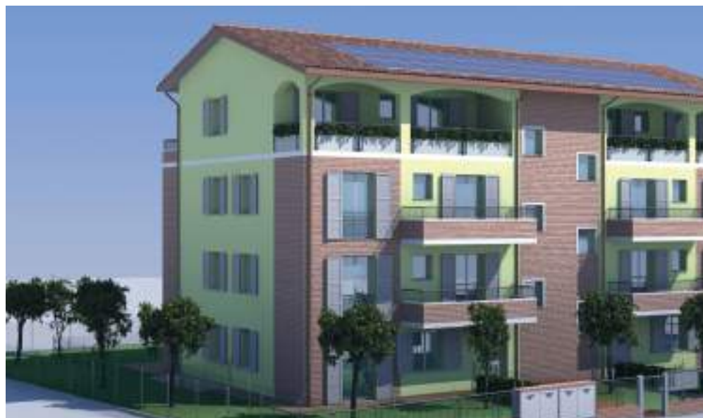
Un dettaglio dei nuovi alloggi in costruzione in via Boschi a Faenza

all'ottenimento di aree a costo zero e allo stanziamento di finanziamenti adeguati. L'augurio per il 2019 è che la regione Emilia Romagna riesca a emanare un bando che consenta la realizzazione di alloggi in locazione a termine e buoni casa per permettere alle famiglie, che hanno i requisiti, di acquistare un alloggio con contributo pubblico". Nonostante lo scenario complesso, Snoopy Casa ha comunque diversi progetti per l'anno in corso: "A Solarolo - illustra Dallara - abbiamo intenzione di avviare un intervento di co-housing composto da una trentina di alloggi. Dal momento che siamo di fronte a una soluzione davvero innovativa pensiamo si possa prevedere anche un intervento da parte del Comune di Solarolo". Per co-housing infatti si intende un comparto residenziale molto ampio, in cui le persone possono socializzare utilizzando anche spazi e servizi comuni come, ad esempio, la lavanderia di quartiere, la mensa, l'asilo o l'alloggio per anziani autosufficienti. Snoopy Casa sta inoltre realizzando un