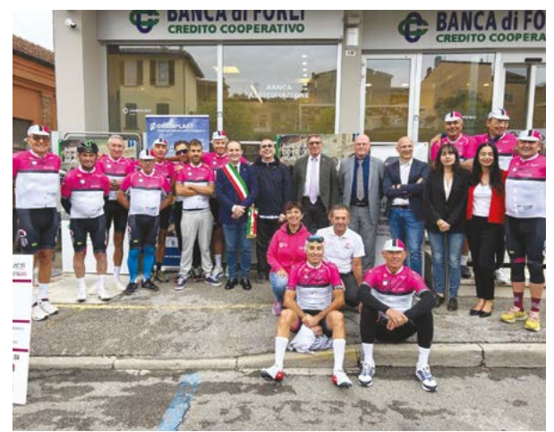
La partenza del 13 settembre da Meldola (FC)