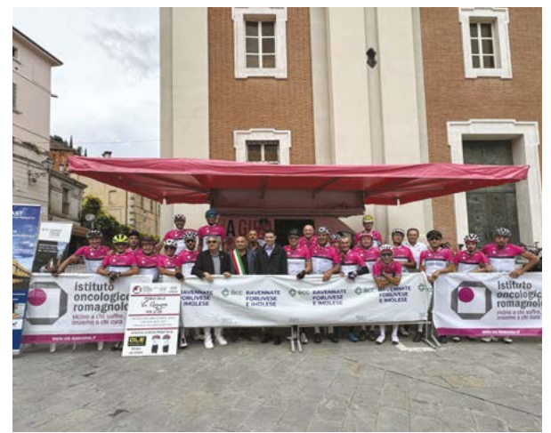
L'arrivo del 12 settembre a Brisighella (RA)