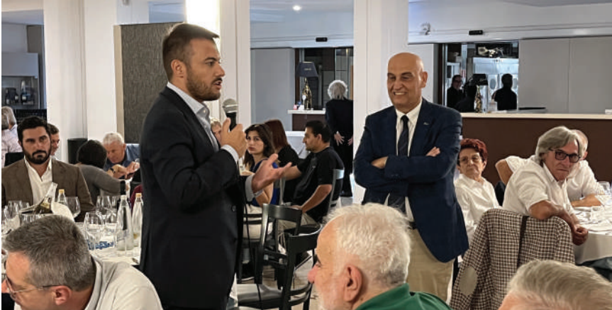
Incontro conviviale con i Soci dell'area di Imola

to una calorosa partecipazione di Soci. Il 21 settembre è stata la volta di Lugo; in ottobre sono previsti gli incontri di: Faenza (il 4); Forlì (il 12) e Cesena (il 19).