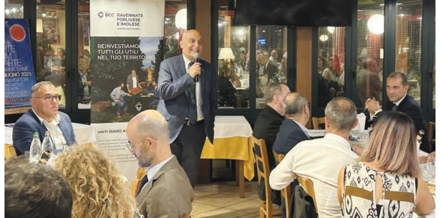
Incontro conviviale con i Soci dell'area di Ravenna