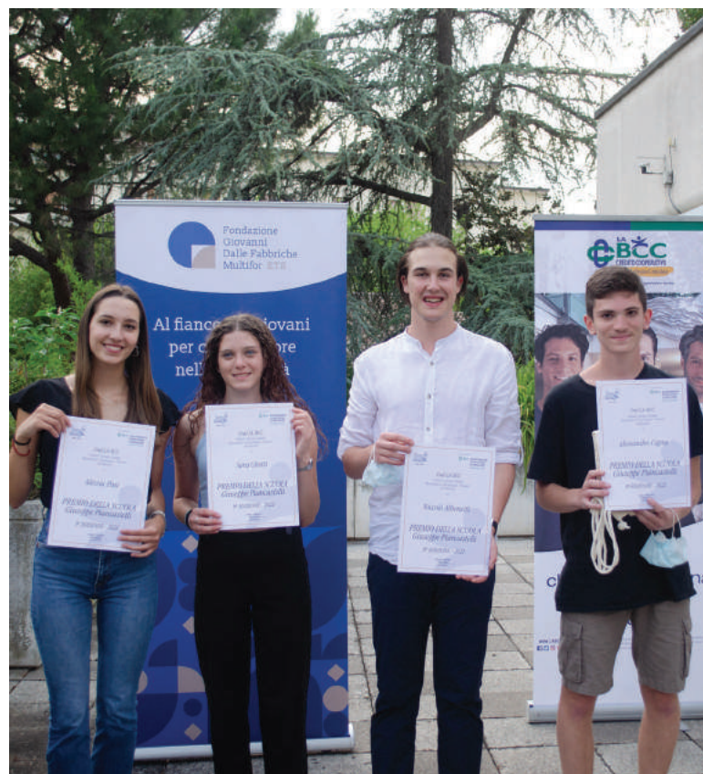
La consegna delle Borse di studio 2022

I bandi sono disponibili sul sito www.labcc.it . Termine di presentazione delle domande: 12 aprile 2023 compilando il form online sul sito. INFO: Ufficio Welfare e Sostenibilità LA BCC 0546.690667 welfare@labcc.it