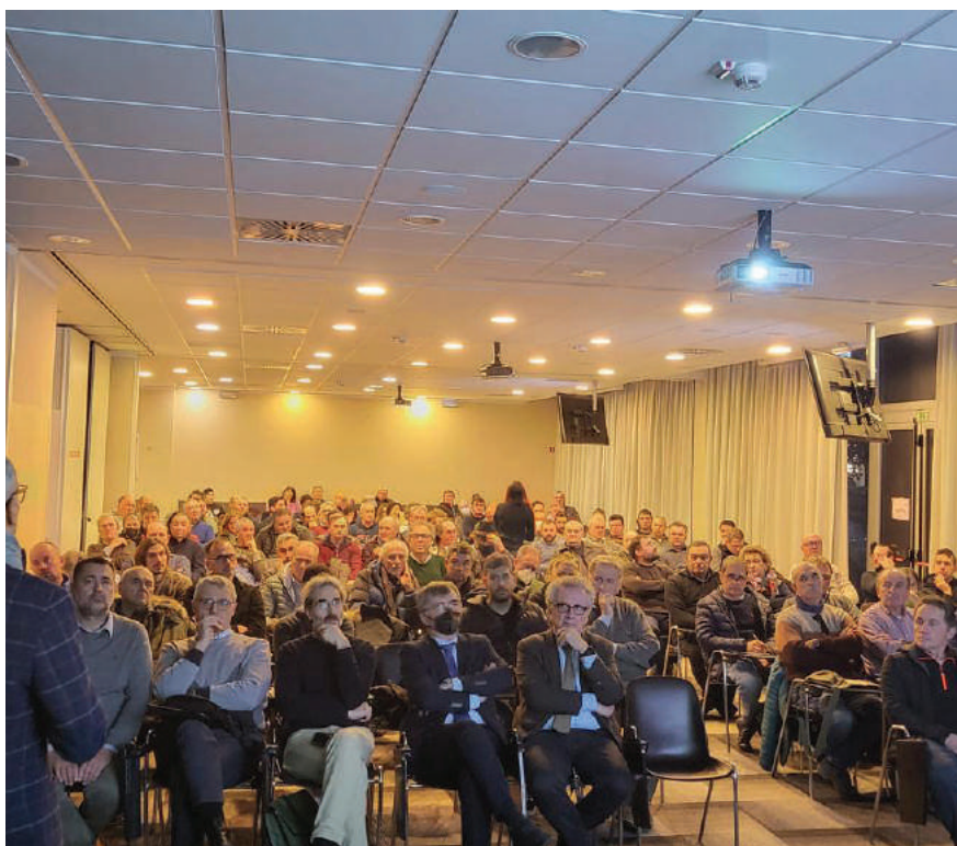
Il convegno Coldiretti a Ravenna

In questi mesi LA BCC ha partecipato agli incontri informativi delle principali associazioni di categoria degli agricoltori. Un momento importante in cui le associazioni hanno illustrato ai loro iscritti le novità introdotte dalla nuova PAC e l’uscita del bando regionale per migliorare l’accesso al credito delle imprese agricole tramite i Confidi agricoli. Con la sua partecipazione LA BCC ha voluto confermare la sua sensibilità alle esigenze delle imprese agricole e a chi lavora in agricoltura. In questi anni, infatti LA BCC ha confermato la sua vocazione di CASSA RURALE con un insieme integrato di finanziamenti, assicurazioni e consulenza altamente qualificata che anno dopo anno si è sempre più specializzata al fine di offrire un servizio sempre più puntuale e rispondente alle specifiche esigenze.